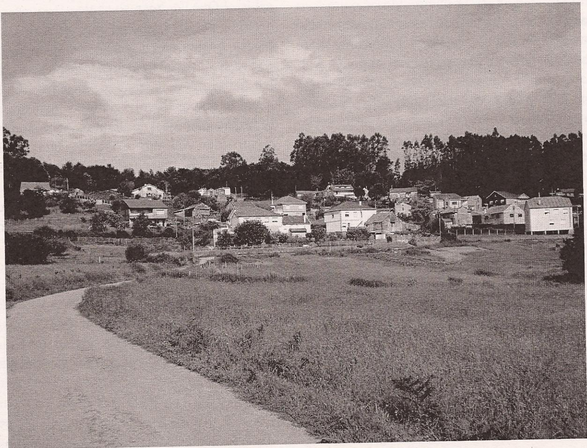
A aldea de Hermelo

Máis alá do camposanto, pola estrada que sae da aldea cara a vila, un coche levaba a unha muller que ía chorando, mentres se afastaba deixando atrás parte da súa vida, á beira do camiño, a vella Palmira, a feiticeira, sabe quen vai dentro daquel coche de