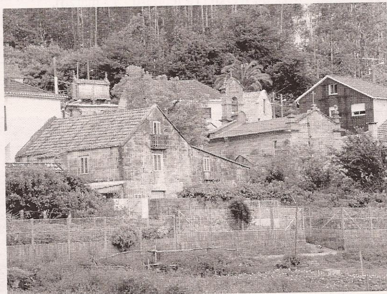
Aldea de Hermelo

Esta e unha pequena homenaxe a esa xoia natural e rural, Hermelo.