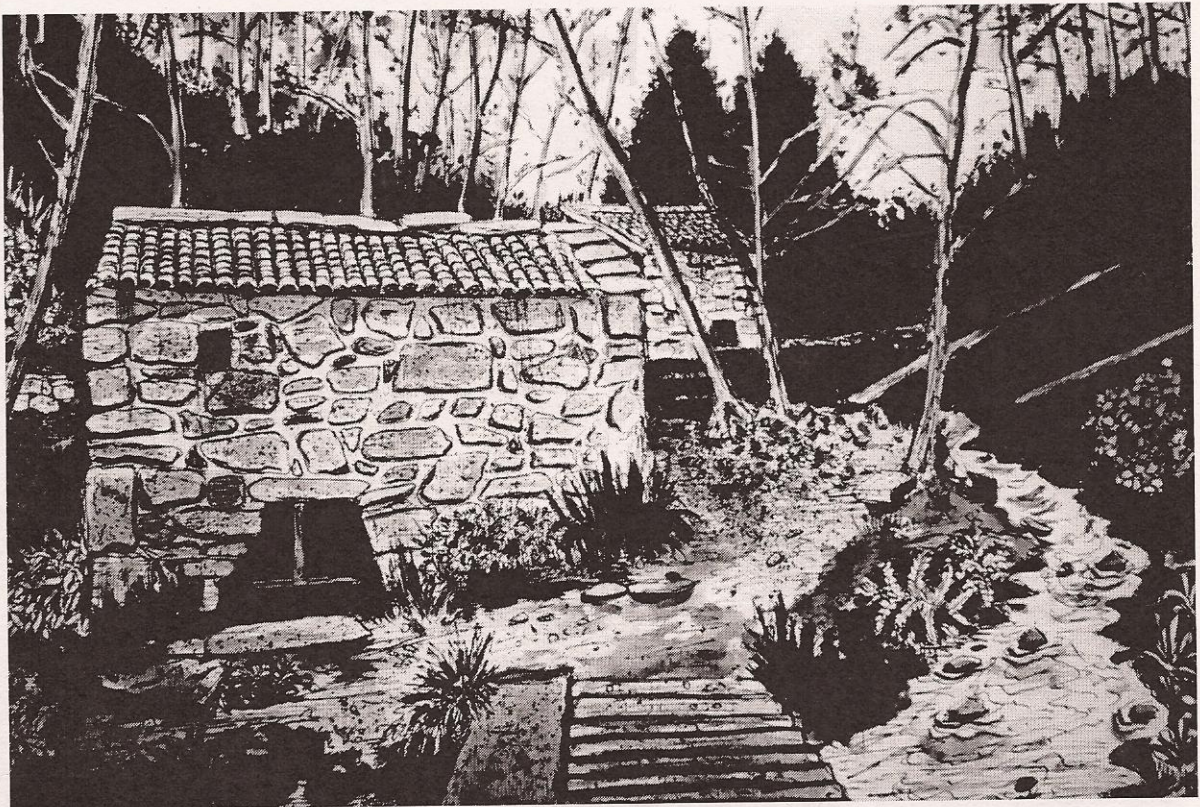
Muíño da presa