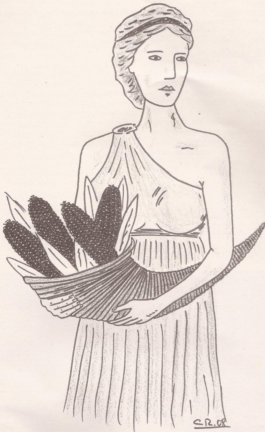
Ceres. Por Anxo Rosende