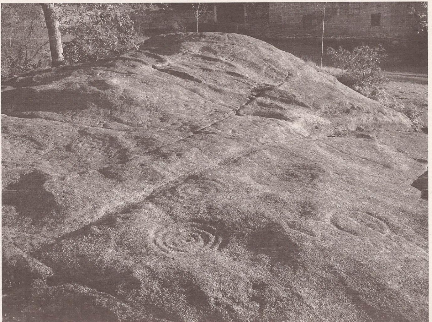
Laxe do Barón, a rocha con gravados máis grande de Galicia

Arestora o Grupo ten en estudio varios proxectos