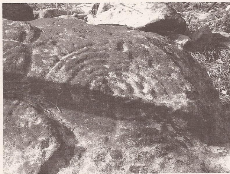
Novs gravados do Retrouso (Tourón).

No mes de agosto de 2007, e no marco da Semana Cultural das Festas das Dores de Ponte Caldelas, impartíuse unha conferencia sobre o patrimonio histórico e etnográfico como axente dinamizador, elevouse a cabo unha visita guiada ao parque rupestre de Tourón, ambas as dúas actividades contaron coa participación de