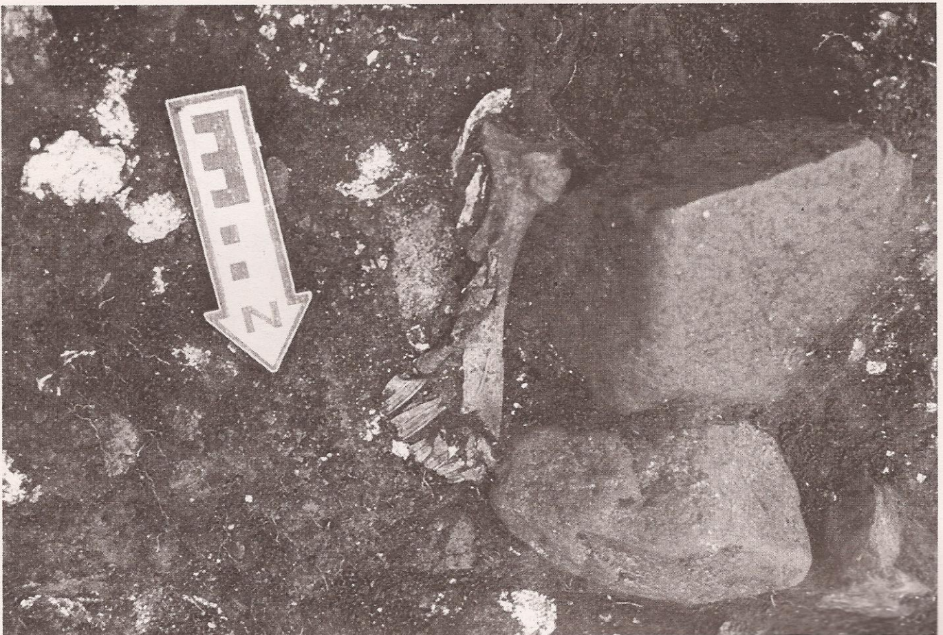
Restos dos ósos dun bóvido consumido nun castro do litoral. Aparece rodeado de cunchas de ostras

Nunca foi un lugar cómodo. Tiñas os muros de pedra e o piso de terra endurecida. Como só tiña un oco, que facía as veces de porta, sempre foi escura. Ademais era moi húmida, porque, aínda que o lume estivese case sempre aceso, tratábase só de brasas. Ao ser redonda, durmíamos enroscados como escánceres arredor do lume, apeguñados ás mantas e ás esteiras que nos servían de leito e cubrían as paredes. Sempre lembrarei o cheiro. Ulía a fume (que picaba nos ollos), a suor, a peixe seco e a manteiga rancia. Coa chegada do calor, era outra cousa. Asabamos peixe, recibabamos o muro e facíamos case toda a vida na porta. Mesmo durmíamos alí, baixo as estrelas, nun pequeno adro cercado por unha muradela. E eu soñaba sentindo o bruar suave da praia.