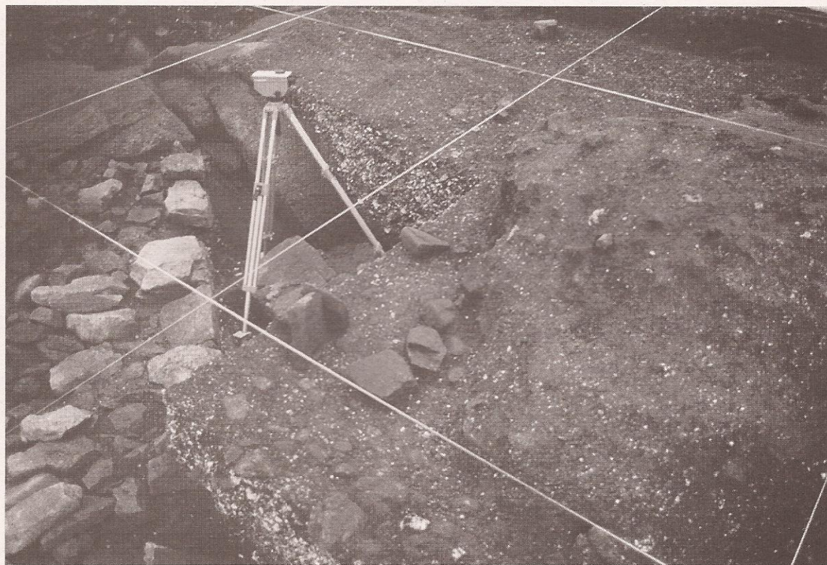
Os concheiros son grandes acumulacións de detritos, sobre todo de restos alimenticios: cunchas e ósos de animais

cunqueirán, facemos da nosa escavación unha outra Miranda e, como un prodixio máis, conseguimos que os obxectos falen. Moitos arqueólogos non pensaron xamais no poder da imaxinación e na validez que ten na interpretación duns restos acotío inescrutables. Pero o importante non é dicir que aquela masa de arxila vermella situada no centro dunha casarota redonda e sumariamente protexida por unhas laxiñas fincadas é unha lareira (porque é obvio). Para nós resulta máis importante soñar a un fato de sombras acubilladas ao seu carón, no chan ou en pequenos tallos, mentres comen sobre tortas de pan ácimo peixe asado e o vento zoa entre as pallas do teito. Porén, o realmente transcendental é contalo, porque o día en que a arqueoloxía xa non refira historias que emocionen, terá deixado polo camiño, esquecida, a función para a que foi creada. Por iso as viaxes polo pasado son itinerarios fascinantes nos que ti podes (e debes) participar activamente. Por iso volve a ser mozo, un mozo de hai 2000 anos.