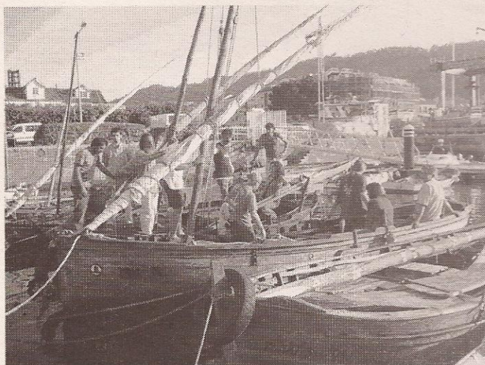
Foto: A directiva casi en pleno