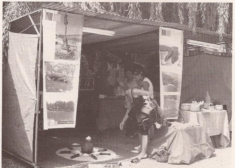
Mostra de Belxica