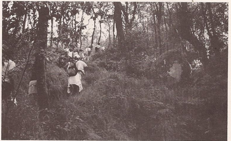
Rutas de sendeirismo