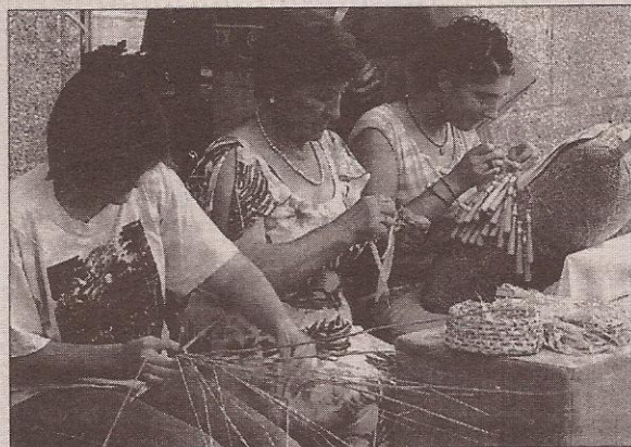
La muestra se celebró ayer por la tarde en Bueu.

La asociación socio cultural de Meiro cerró ayer domingo los actos con los que celebró "O rexurdir do millo corvo. Testemuña dunha tradición". A última hora de la tarde se desarrolló una pequeña muestra de artesanía, en la que se exhibían productos tradicionales. Ésta tuvo lugar en la explanada del Centro Social do Mar y concitó la atención de numeroso público, tanto vecinos de Bueu como veraneantes. De este modo el colectivo de la aldea de Meiro culmina unos intensos diez días plagados de actividades, talleres, actuaciónes culturais e juegos populares.