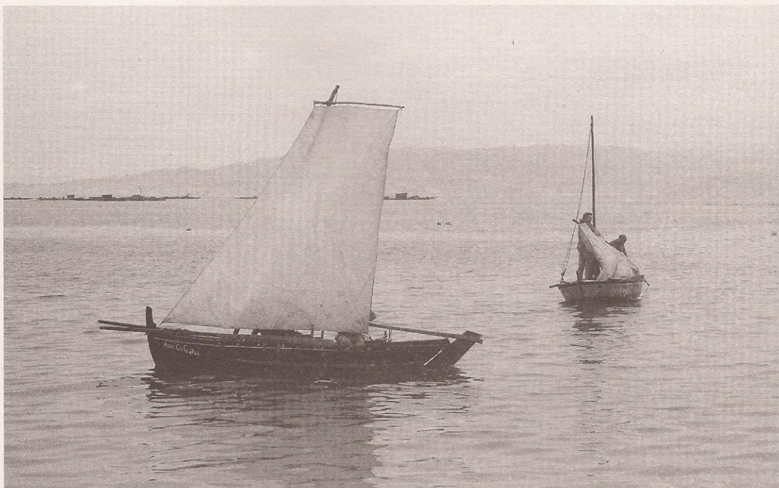
Dornas en Bueu.

Podemos decir que, moitos dos conflitos que actualmente inciden no mar galego son cáseque os mesmos de hai 100 ou 200 anos: escasez da sardiña, conflitos co cerco... A problemática que rodeou sempre á pesca a ardora non se solucionou nese 1912, e aínda hoxe, só que con diferentes motivacións, ardoristas como os do Morrazo continúan a solicitar a ampliación nun día, das xornadas semanais desa pesca permitidas por lei.