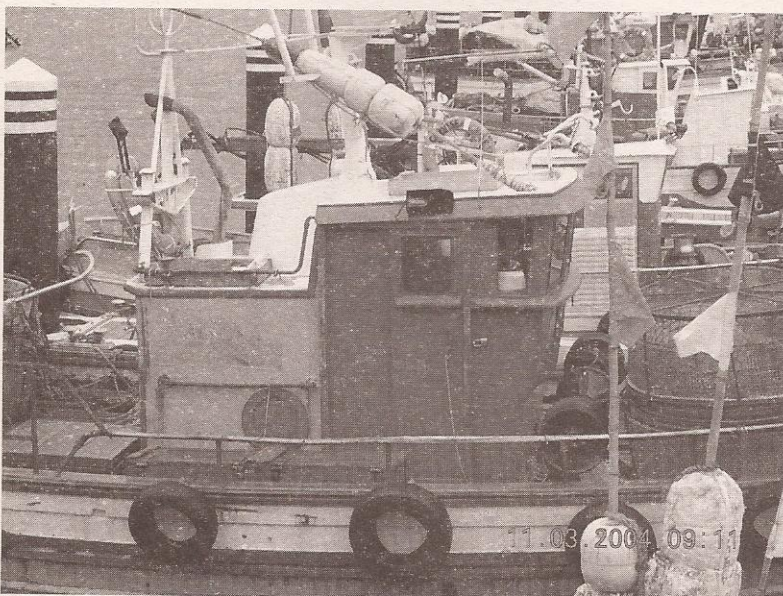
Porto de Bueu.

Os traballadores da pesca en costa tamén desenvolven técnicas propias para a localización do peixe, procedementos e sabidurías recollidos despois de anos de mirar para o mar. Poderíamos falar do axexo ou do caldeo, pero sen dúbida ningunha a ardora é o sistema de busca tradicional máis coñecido en todo o litoral galego. A ardora (ou escurada), realízase nas noites de lúa chea. A embarcación surca o mar paseniñamente, con todos os mariñeiros en silencio. O patrón sitúase na proa fitando á superficie, axudado pola claridade e sabedor da fosforescencia que os bancos producen cando andan entre o plancton. De cando en vez indícalle a un mariñeiro que