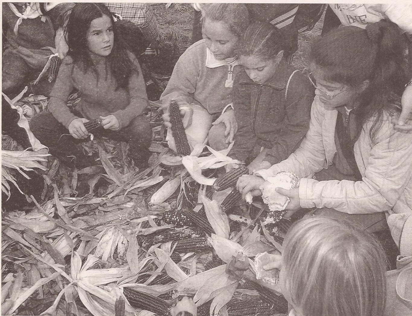
Limpando o millo.

Si fose xove trataría de razoar cos meus maiores, cos mais anciáns, trataría de facelos comprender que cada xeración ten unha etapa de forma distinta, que eles cando foron xoves tamén fixeron das súas. Coma quen dí o mesmo que agora fan os xoves, aínda que a situación é