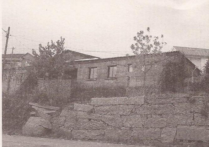
Escola de Meiro.