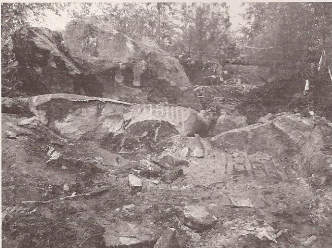
O que queda do Petroglifo de Gondarán (Cangas). Era Ben de Interese Cultural, catalogado e protexido pola Lei.

No apartado de patrimonio histórico dicíase no estudo que non había ningún xacemento afectado polo trazado, e ningún concello do Morrazo alegou nada en contra. Tiveron que recoñecer a afección a 31 xacementos arqueolóxicos e a destrución de 13 deles, tralas denuncias da Plataforma Anti-Vía Rápida, aínda que ese recoñecemento non supuxo variacións de trazado para salvar eses elementos do patrimonio histórico, a pesares de que a Constitución Española da prioridade á protección ambiental e cultural sobre a política económica (Art. 45 e 46).