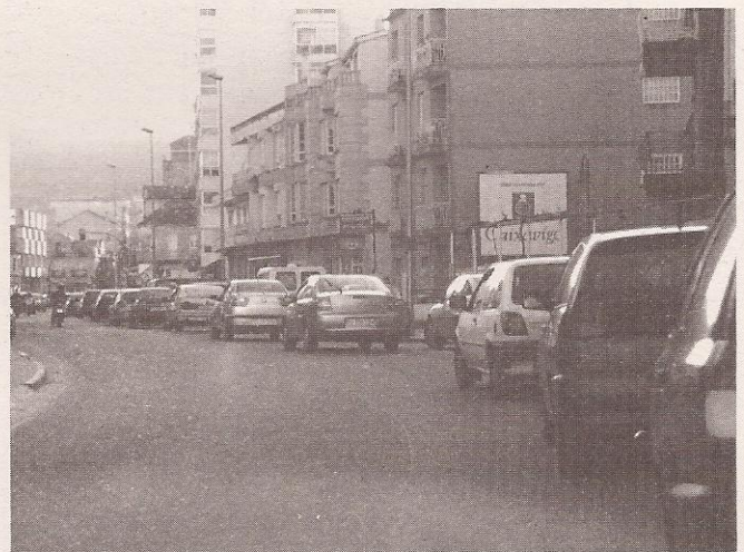
Atascos á entrada das vilas, que non resolverá este corredor.

Pero non só pisotean os dereitos dos que nos opuxemos a esta obra. Búrlanse da poboación enteira, pois coa manipulación da información e a utilización de todo o seu poder de propaganda, deixan ao cidadán indefenso. O control da información fai que se difundan ata chegar a asumirse as ideas que eles queren que asumamos. Consiguen que non se cuestione a vía rápida e incluso que se demande, porque ben se coidan de non falar doutras alternativas para mellorar a mobilidade, xustamente as que se aplican hoxe nos países avanzados. Ocultan a información para evitar a reflexión e as posturas racionais ou críticas, facendo así que aceptemos encantados o modo de desprazamento máis caro e ineficaz. Cremos que o coche nos da liberdade pero estamos nas súas mans.