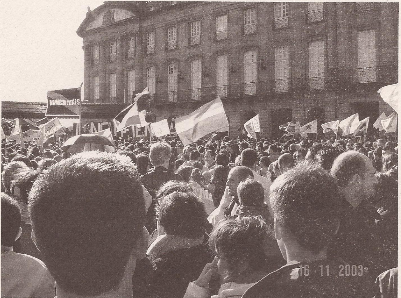
Manifestación do pasado mes de novembro en demanda de responsabilidades pola catástrofe do Prestige.

Queda cuestionada a democracia deste país, cando os procedementos de salvagarda do sistema son burlados pola autoridade que debe garantilos. Se a Lei obriga a que este tipo de obras inclúa un Estudio de Impacto Ambiental, é precisamente para protexer o territorio e os seus valores ecolóxicos, culturais ou históricos. Se dito estudio faise de trámite, sen rigor, por cubrir o expediente, estamos ante unha administración sen vontade de protexer os valores do país, sen vontade de cumprir a Lei, estamos ante unha administración antidemocrática. Non lle interesa protexer os bens