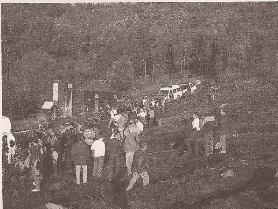
Protesta no Caeiro