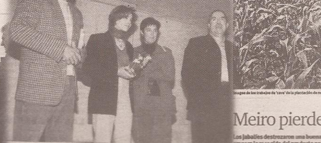
Unha mesa que representa o inicio das datas navideñas en Meiro, onde se celebra o Balén de Meiro.

Los habitantes de Bueu a participar nesta tradicional actividade