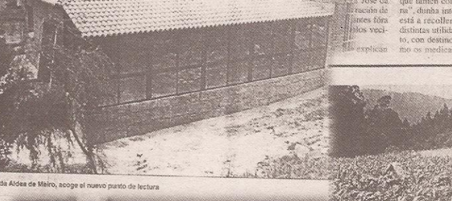
La Casa da Aldea de Meiro, acoge el nuevo punto de lectura

Los integrantes de la asociación sociocultural de Meiro lograron rescatar el maíz negro de Meiro. En Meiro, melidas por la fuerza del agua y la presión de la rueda de piedra del molino de A Presa. Esta es la segunda vez que la asociación sociocultural de Meiro organiza esta actividad para la difusión de la tradición agrícola. Las buenas cosechas comen la "chela corvo".