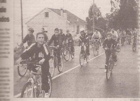
Un momento da popular concentración de bicicletas celebrada, na mañá de onte, en Meiro.

La comisión de gobierno de Bueu aprobó ayer el paso por la red de gas entre Meirín y Cascais, que llevará a cabo Gas Galicia. Pero después su trazado que la Dirección Xeral de Patrimonio emita un amplio informe sobre la afectación de la calzada romana en Meiro, cuya zona es incluida en los planes de la empresa. El grupo de gobierno asegura que las tuberías deberán evitar estos restos históricos, y variar el trazado para no afectarlos.