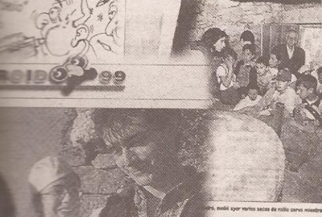
Unha mesa que representa o inicio das datas navideñas en Meiro, onde se celebra o Balén de Meiro.

Jueves 14 de marzo de 2008 MEIRO POR HOJE YA NON SOU UNO DOS MEIROS POR AQUÍ A MEIROS