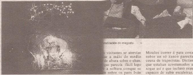
Recepción do magosto

Maxxe que presentaba, onte pola tarde, o singular Balén de Meiro.