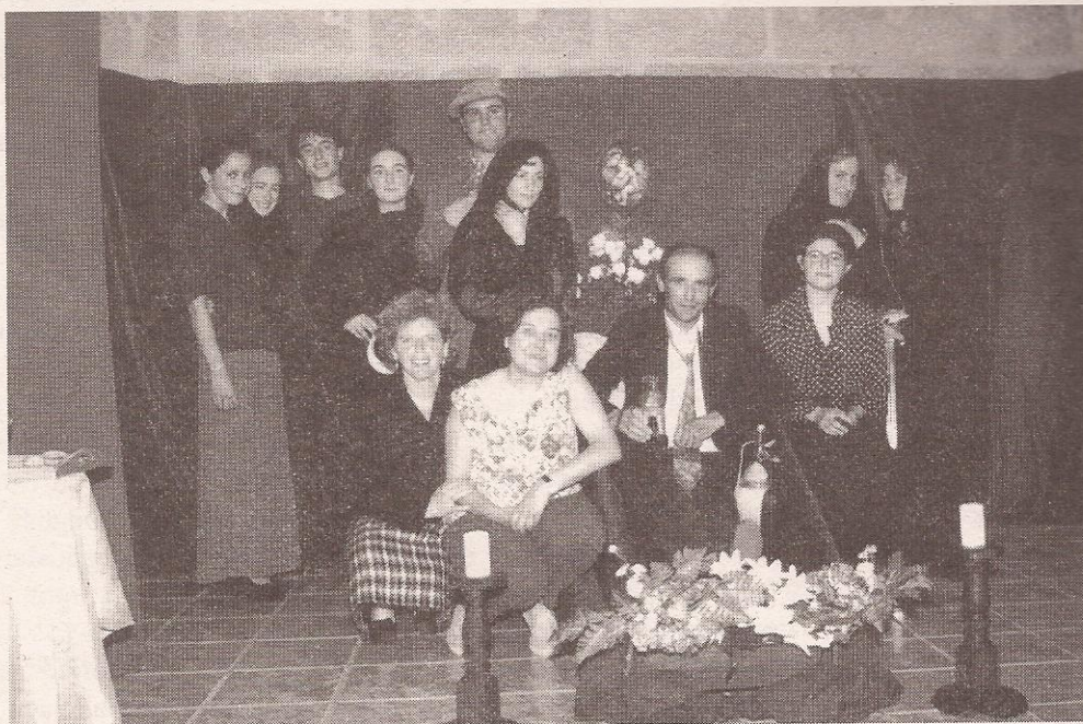
Cravos de prata

E Meiro non podía ser unha excepción. En terra de xentes inxeadas, non podían faltar amantes do teatro. Hai aproximadamente tres anos a Asociación Sociocultural, Deportiva e Xuvenil de Meiro botaba a andar un grupo que hoxe leva o nome de Simalveira.