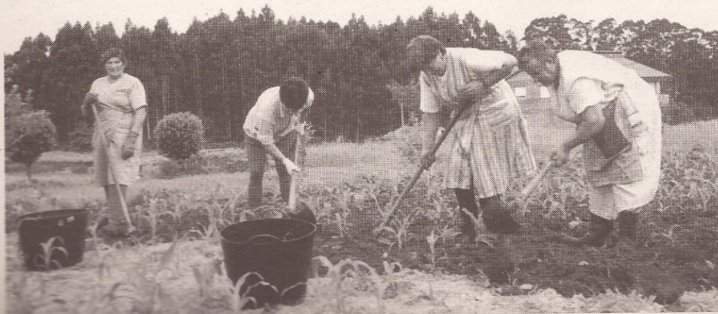
A casa do millo corvo. Agrosouto.