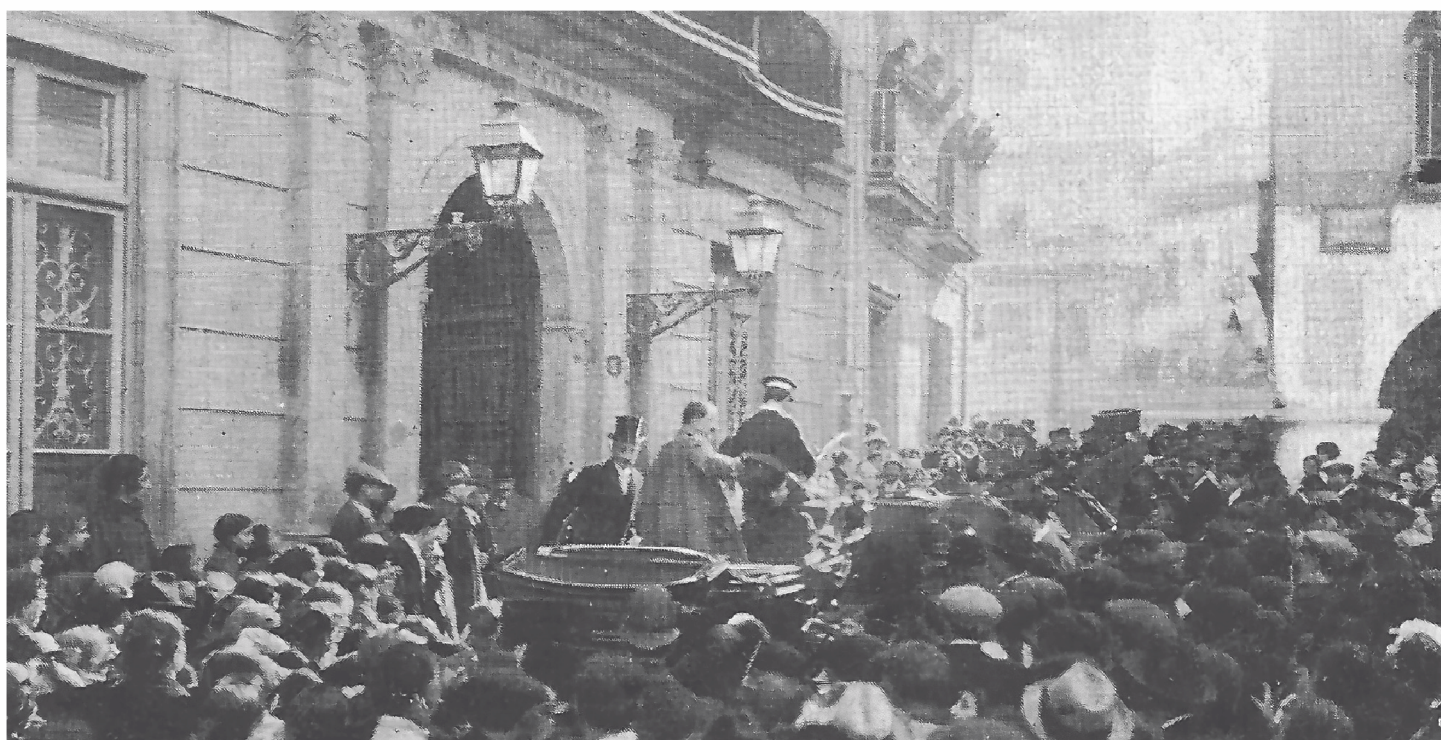
Recepción do pobo de Vigo ás heroínas