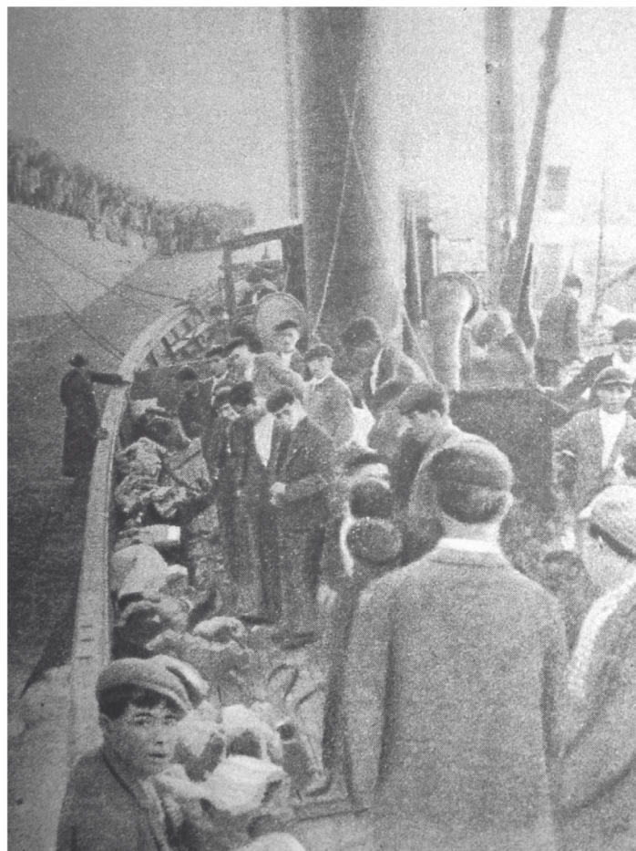
O vapor Rosiña chegando a Ribeira cos primeiros cadáveres e superviventes do Santa Isabel

”Amenceu e sempre tiña a esperanza de que chegasen auxilios e non tivésemos necesidade de arria-lo referido bote, pois, dado o mar que había, resultaría perigoso, pero a iso das nove da mañá empezou a afundirse aquela parte da popa, seguramente porque partira en dous o barco, quedou o salvavidas sobre os calzos e chegou o mar a onde estaba e flotou e quedou fóra do barco con tódolos que meteramos dentro do mesmo, quedando fóra na cuberta algúns que sabían nadar; que se meteran, ó caer á auga arrastrados por outro golpe de mar dentro do mesmo, cos demais náufragos.