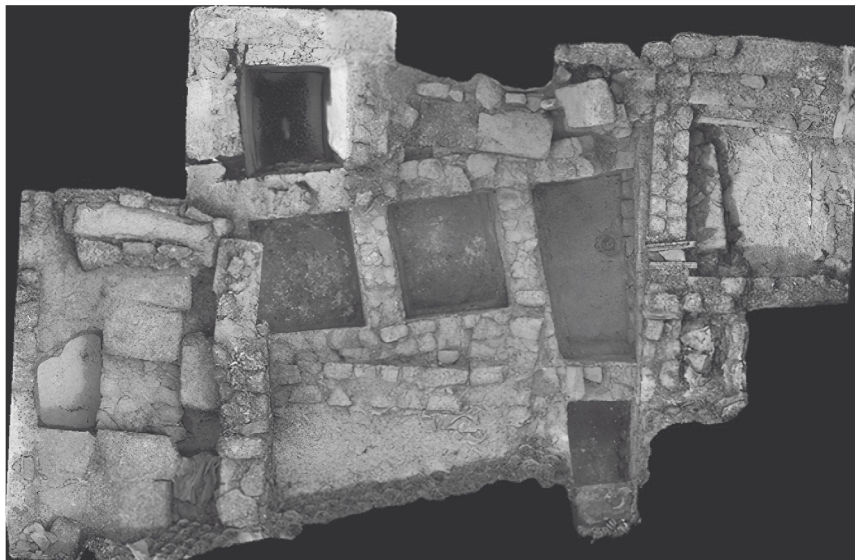
Modelo 3D onde se poden ver os 4 píos de salga da fábrica romana de Adro Vello baixo outras estruturas posteriores.

A primeira fase do xacemento segue a ser a fábrica de salga de época alto imperial. Posiblemente abandonada durante o séc. III d.C. O máis probable é que co-exista cunha zona habitacional, posiblemente unha villa marítima que perdura ata un momento, polo de agora, indeterminado. A inicios do medievo, sécs. VII-VIII, constrúese un importante complexo edilicio, seguramente de carácter eclesiástico. Desta igrexa ou mosteiro tense constancia nun documento do ano 899, como parte das posesións do episcopado de Iria, que o rei Alfonso III confirmaba (“ et ecclesiam Sancti Uincentii in insula Oobre cum dextris suis ”). Anos despois, xa no séc. X, o rei Ordoño II ratifica esta doazón xunto con outras na zona do Salnés (“ ...Arauca medietatem de ea cum sua ecclesia et suis salinis, sanctam Eulaliam de Aobre, que nuncupant Arealonga et sanctum Chritoforum cum bonis suis, sanctum Uincentium de Ogobre cum suis terciis et cum omnibus ”). As escavacións recentes aportaron abondosos datos arqueolóxicos que demostran a existencia deste edificio alto medieval asociado a numerosos enterramentos.