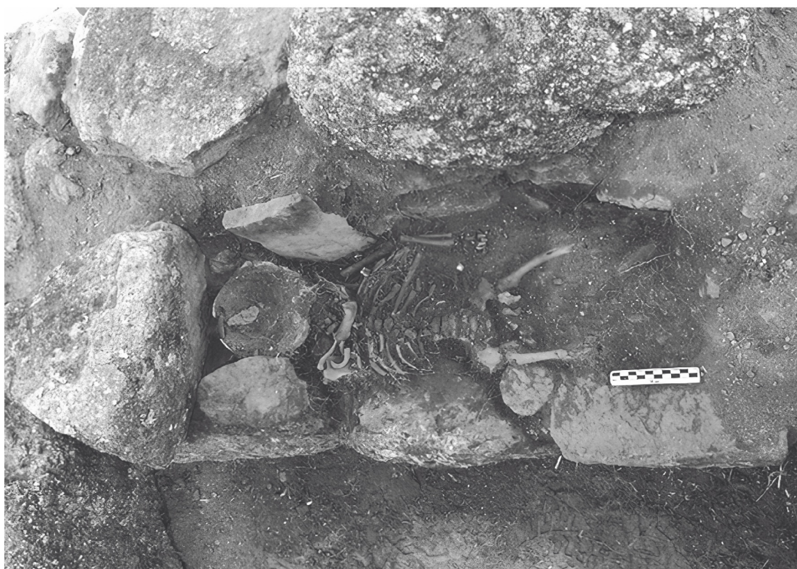
Enterramento dun neno aproveitando un dos muros medievais como sepultura