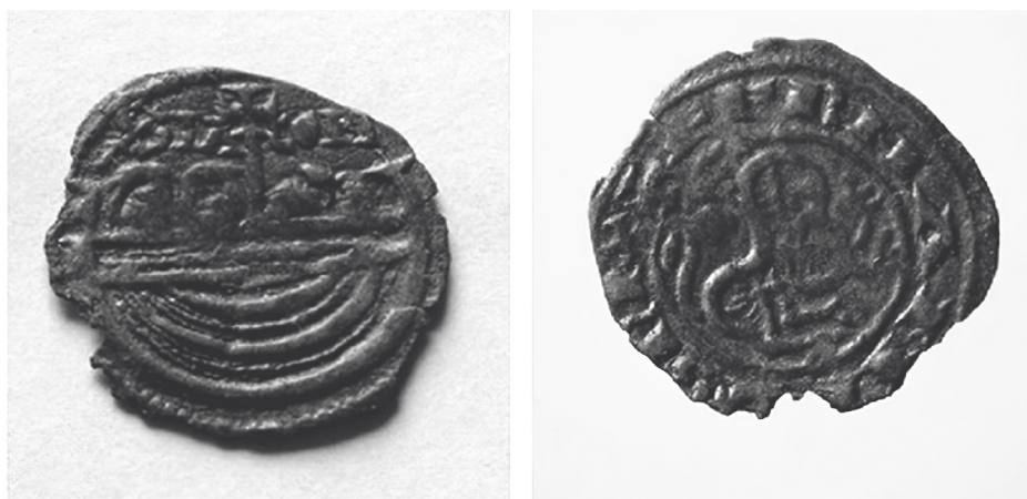
Moeda da traslatio

No tocante a achados destacados na historia das intervencións poderíamos citar a ara romana dedicada a divindade Deveros, que apareceu reaproveitada nos muros da igrexa. Mais a peza aparecida con maior fama é, sen dúbida, a moeda repuxada de doce milímetros de diámetro, fabricada en torno ao século XII, na que se amosa a primeira representación coñecida da traslatio do corpo morto do apóstolo Santiago dende Palestina até Galicia. Este tesouro numismático de Adro Vello atópase na actualidade no Museo das Peregrinacións, en Compostela. En 2017, a UVigo recuperou no interior dun dos píos de salga abundantes restos de peixe (un 98% de sardiña e 2% de xurelo) que supón a mostra máis abundante de peixe antigo recuperada no noroeste da Península en contexto de produción. Grazas a esta mostra sabemos que se estaban a producir en Adro Vello prebes de peixe a partir de sardiña que seguramente eran exportados cara a outras zonas do mundo romano.