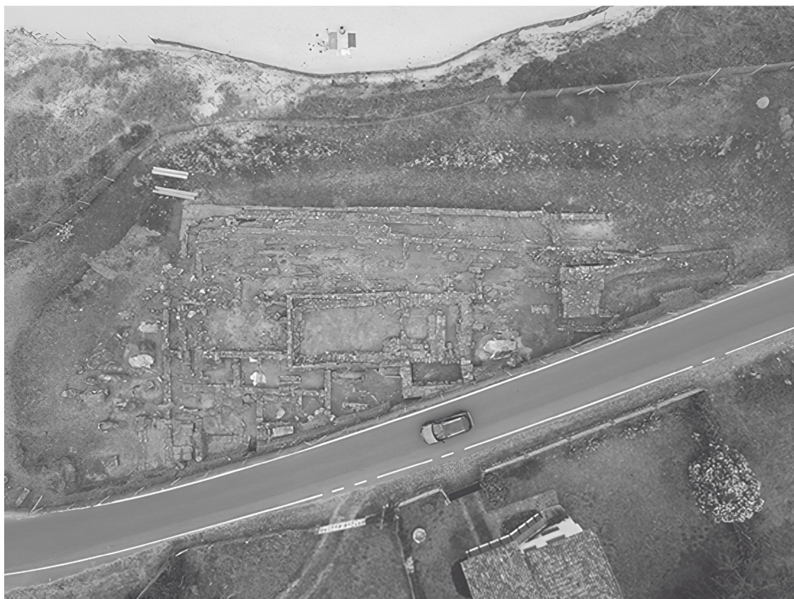
Foto aérea co xacemento totalmente limpo (verán de 2022).