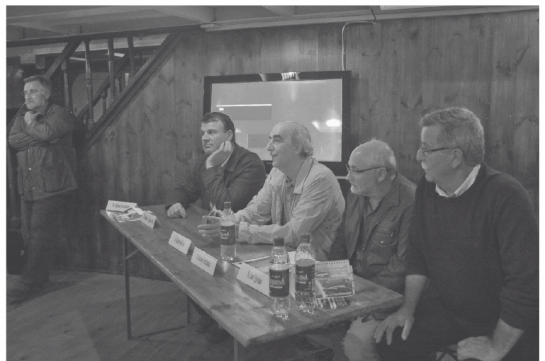
Cultivando o mar celebrado o 9 outubro 2008 no barco Nieves

“... uns biólogos mariños bastante novos, comenzamos a falar do futuro da Acuicultura Mariña, ....A persoa que imaxinou e impulsou o I Ciclo de Cultivando o Mar, consciente desta riqueza intrínseca galega e a súas necesidades de divulgación, debate, e preservación documental e práctica..que durante estes 35 anos persistiu nesta tarefa inusual e tan valiosa no mundo actual (superacelerado e..tan só de presentes..) que estamos a vivir..... onde consultar as mais diversas (e todas) as facianas do noso mar..Un traballo increíble..”