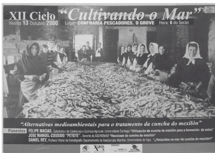
Cartel anunciador do XII ciclo Cultivando o mar: Tratamento da cuncha do mexillón. 13 outubro 2000. Foi una das edicións de Cultivando o mar con maior asistencia de público

“...realizamos una xuntanza entre empresarios e investigadores interesados nos recursos mariños co fin de achegar un pouco máis estes dous mundos dun sector en continua expansión. Nesta reunión púxose en contacto a investigadores e empresarios ou técnicos de empresa, para resolver problemas concretos ou ben desenvolver proxectos comúns...”