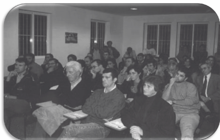
Público asistente ás charlas de cultivando o mar na Confraría de mariscadores