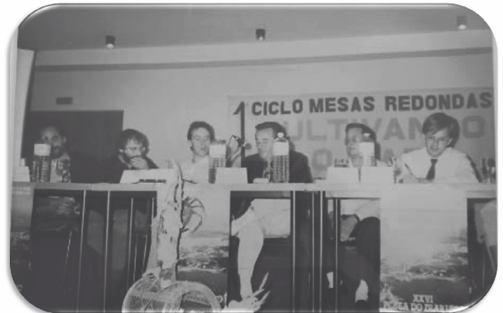
Primeira edición ciclo Cultivando o Mar celebrado na casa de Cultura de O Grove en outubro 1989

Es una oportunidad nada fácil, pues los científicos, tienden a tener una visión enfocada a un aspecto muy concreto y los acuicultores, muchas veces se basan en su experiencia de años, que puede no estar soportada en conocimientos actuales”