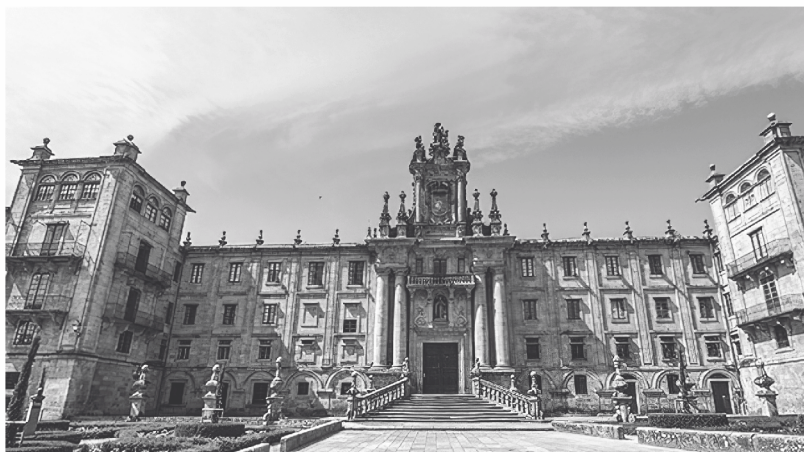
Arquivo Diocesano de Santiago de Compostela.

E así foi, tróuxonolo fotocopiado, lido e ben estudado. Foi nese intre cando comezamos a contactar máis asiduamente e convencémolo para escribir un artigo sobre o Foro. Como bo investigador, nos ratos libres que lle permitían as súas pescudas e o seu labor profesional, púxose a buscar máis documentación sobre Ons e, a dicir verdade, en pouco tempo atopou a suficiente como para provocar nel un interese cara á Illa e á súa historia.