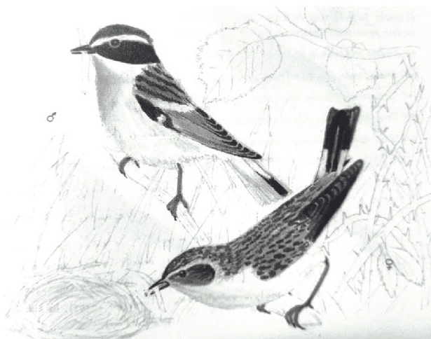
▲ Fig. 3. Ilustración do chasco rabipinto en Aves da Costa .