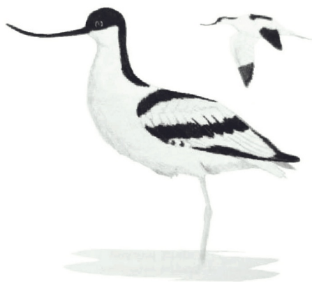
▲ Fig. 2. Ilustración da avoceta en Aves da Costa .