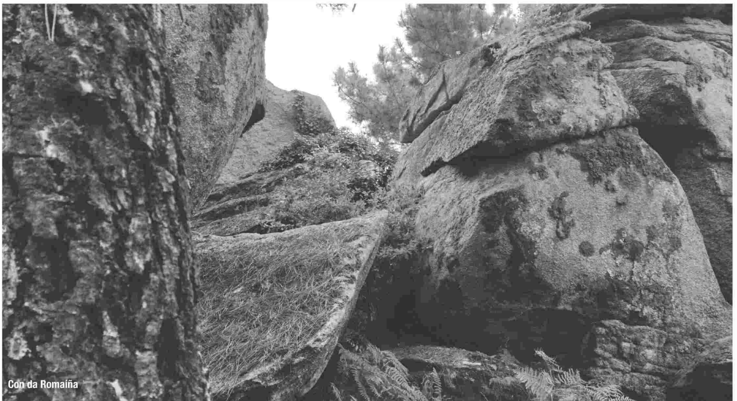
Con da Romaiña

Mellor fin tivo a protagonista do Con da Ventureira, que foi o seguinte emprazamento a visitar. A lenda do Con da Ventureira conta como unha rapaza que baixaba de coller leña ou que estaba gardando as ovellas, viu unha moura enriba do penedo, peiteándose cun peite de ouro. A moura baixou ao carón da rapaza a secarlle a suor coa súa man dereita. Logo de facelo, bicoulle a fronte e levouna ao seu pazo debaixo da pedra.