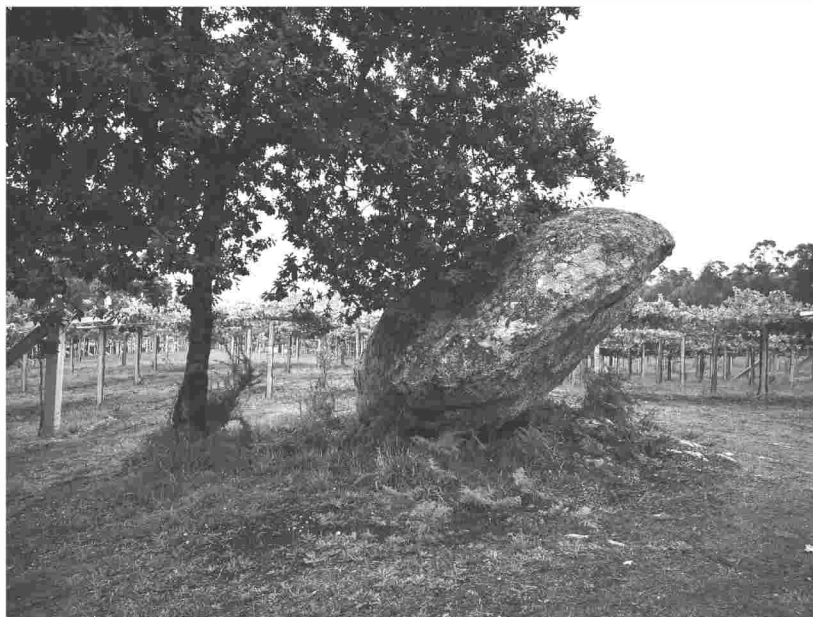
Pedra Cabalaria. Lores

e de promesas de futuras incursións a través das pegadas da historia e das marabillas desta natureza nosa tan xenerosa en cores e relevos. Entón, que conclusión tiraba daquela experiencia? Topara algunha resposta ás miñas dúbidas? Ecos marmurios das ondas de Major ao fondo, lembrei unha cita de Rabindranath Tagore: “Coma un mar, arredor da soleada illa da vida, a morte canta noite e día a súa cantiga sen fin”... E engadín para os meus adentros: “Pero se somos capaces de escoitar a cantiga significa que inda estamos vivos”. E deixei o meu corazón danzar aquela melodía na compañía daquel novo clan que acababa de nacer de entre a auga e as pedras dunha Noalla máxica e eterna.