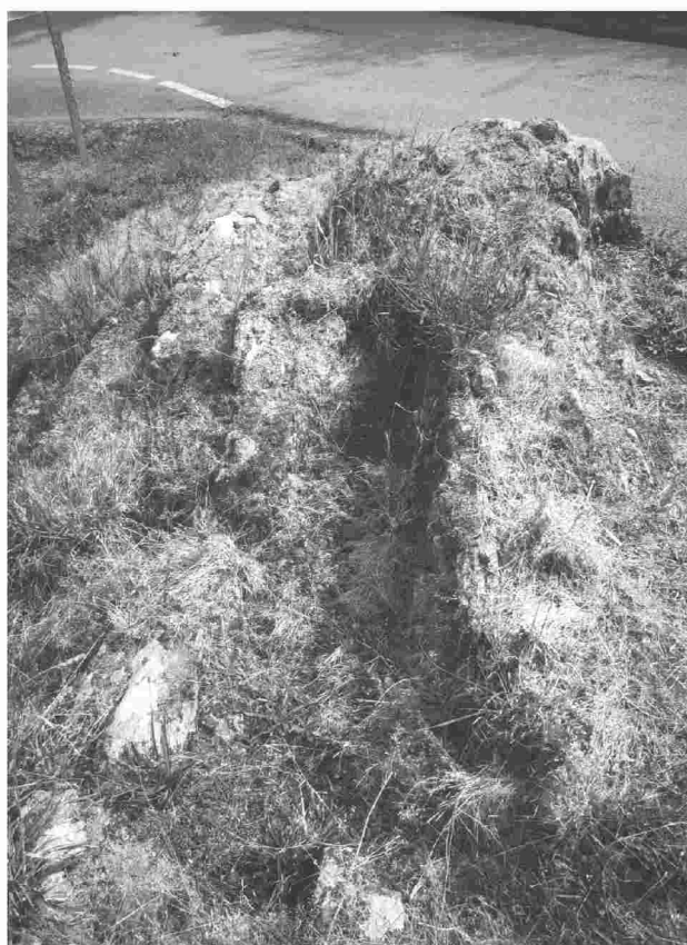
Tumba antropomorfa. Igrexario de Vilalonga