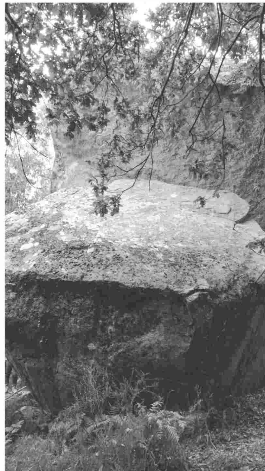
Con da Ventureira

Brindes, anécdotas, gargalladas, pensamentos e debates compartidos... Ollei ao grupo. Sentados, sorrintes e cheos de vida, de proxectos