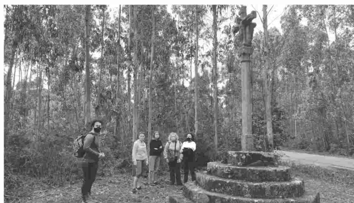
Cruceiro Monte Faro

Desfacendo o noso camiñar, dirixímonos á seguinte parada: O Cruceiro do Monte Faro. Un cruceiro diferente aos demais, con caliveras gravadas e unha forma atípica, pero coa mesma relación coa Santa Compañía que todos os seus