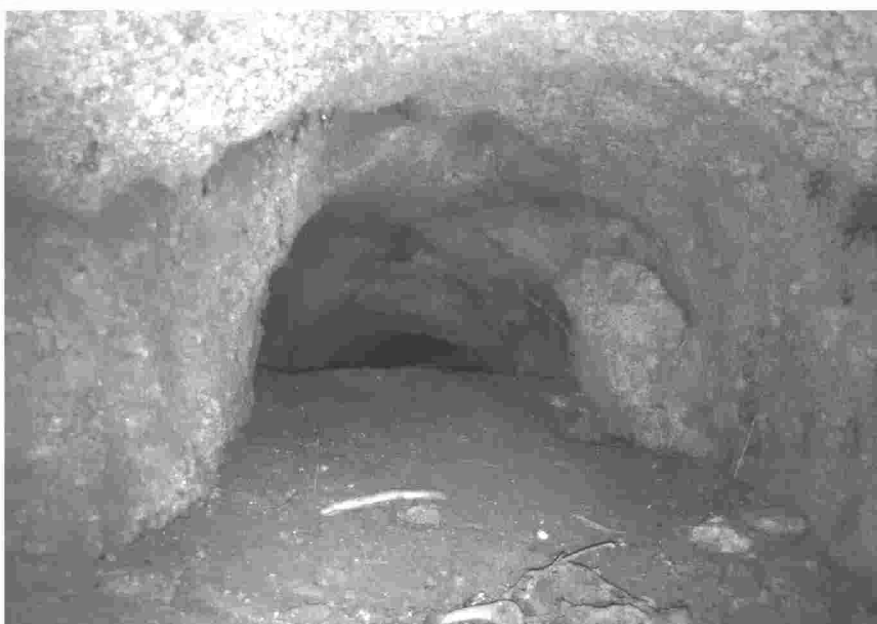
Galería inaccesible das minas de auga