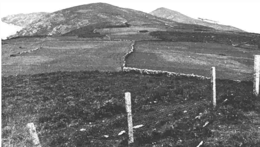
Ata hai ben pouco, a Illa tiña todas as súas terras dedicadas a cultivo, pasto ou monte para estrume. Foto: terras ao norte do Faro, todas cultivadas.

Estes novos agricultores ven na Illa o fin das penalidades que estaban a pasar no continente pero, á vez, vanse a atopar cun enorme traballo para sacar rendemento ás terras e poder afrontar a súa precaria economía. Vai ser coa instalación na Illa dunha fábrica de salga arredor do 1837 e coa chegada de mariñeiros a vender e á vez comprar, nun primeiro intre, produtos agrícolas, o que vai a traer un respiro á difícil economía illán.