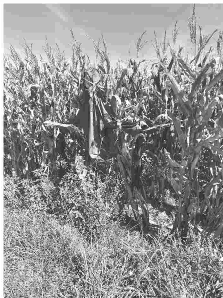
Espantallo feito cun traxe de augas vello suxeito por un pau

distancia das casas, lavar a roupa nos lavadoiros e tendela, facer a comida, ir pola compra máis necesaria,..., atender aos animais, levalos ao monte,..., e ata algunhas a realizar traballos fóra da súa casa. Con estas premisas, aínda que en Ons todos axudaban cando podían, eran os rapaces os encargados do labor de espantar aos corvos das colleitas, tendo, nas épocas cando o millo estaba a punto, que deixar de ir á escola para poder realizar ese traballo que, por outra parte, a maioría das veces, facían encantados.