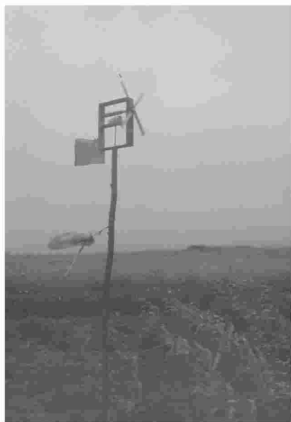
Artefacto construído polo Ruso para espantar os corvos

O home ía ao mar e a muller tiña todas as faenas da casa que, nunha Illa como Ons e ata hai ben pouco, se multiplicaban nunha vivenda sen luz, auga corrente, sen baños,..., o que obrigaba a ir por auga as fontes, algunhas a unha boa