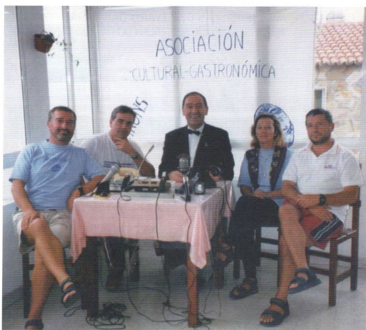
Primeira Xunta Directiva da A.C. PineirÓns 1998.