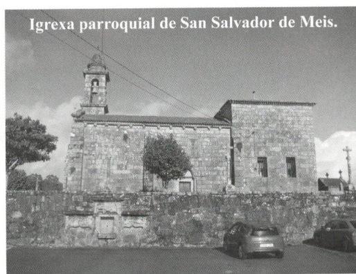
Igrexa parroquial de San Salvador de Meis.

Do normal saese os días de festa co repicar. Para iso xa hai que, ademais de coñecer a teoría, ter algo de