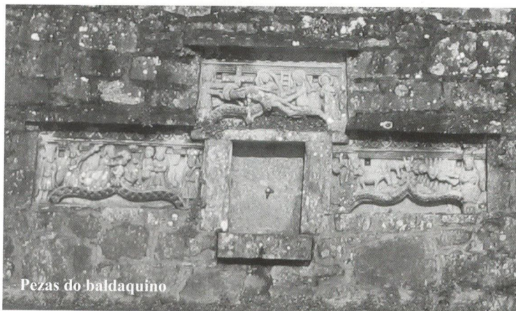
Pezas do baldaquino