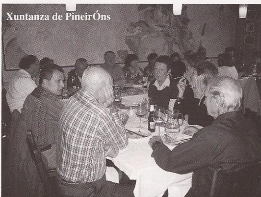
Xuntanza de Pineiróns

alvariño que serviu para mollar e reparar, polo esforzo realizado, as deterioradas cordas vocais.