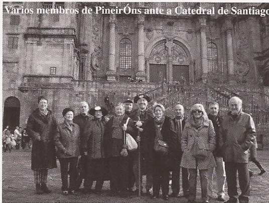
Varios membros de Pineiróns ante a Catedral de Santiago

A pesar da indisposición do noso Presidente e da nosa Secretaría, "almas mater" desta actividade, que non puideron acudir a Ons, varios membros da Asociación xunto con amigos que se atopaban ese día na Illa, argallaron unhas coplas, que tiñan que ver con sucesos ocorridos durante o ano en Ons, e se dispuxeron a cantalas. Hai que dicir que os textos levantaron as risas dos presentes que pouco a pouco se foron convertendo en gargalladas ao escoitarnos cantar tan desafinados e faltos de ritmo; pero ben, a festa pagou a pena e tanto en Casa Acuña como na de Checho, convidáronnos a unhas boas tapas regadas cun excelente viño