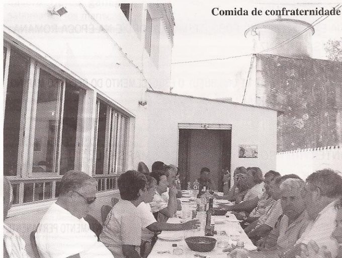
Comida de confraternidade

Tamén un bo número de socios realizou a, tamén tradicional, peregrinación de Santiago a Fisterra, visitando os lugares máis emblemáticos da Costa de Morte de Muxía a Fisterra.