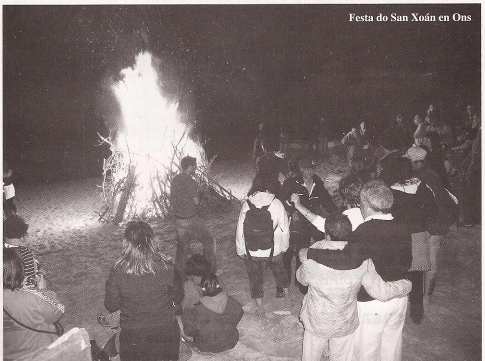
Festa do San Xoán en Ons

De todos os xeitos estivemos traballando moito na súa preparación e quedou posposta para este ano 2008.