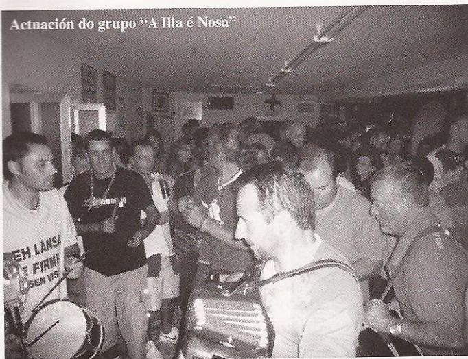
Actuación do grupo "A Illa é Nosa"

O traballo resultou moi gratificante pero difícil de levar a cabo, xa que estes aspectos tan importantes da nosa etnografía estanse a perder a pasos de xigante e, ata nunha illa que permaneceu tan pechada e illada ata os anos 70 do pasado século, en menos de 30 perderon todo o adquirido e realizado durante case dous séculos.