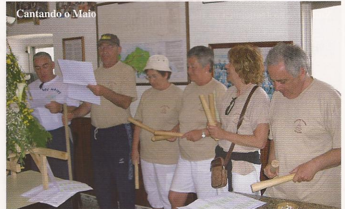
Cantando o Maio