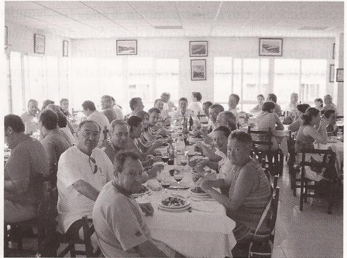
Comida na Illa de Ons

Como colofón, un percorrido pola fermosa vila e paseo ata a veciña Monçao, mostrando aos que por primeira vez nos acompañaban, as belezas de ambas localidades.