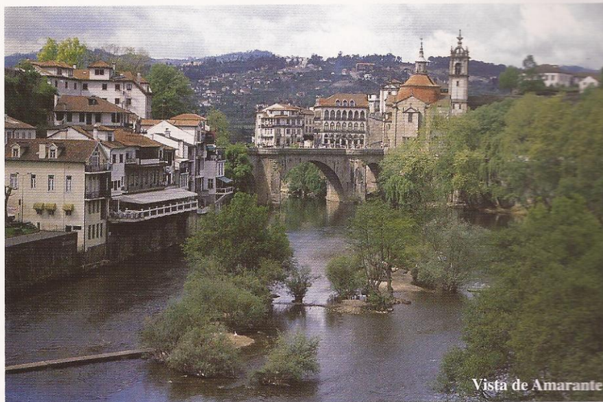
Vista de Amarante

A cidade está bañada por el río Támega que ten o seu nacemento en la provincia de Ourense. Conxuga río y serras. Profundamente relixioso, de lo que da fe la gran cantidade