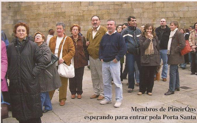
Membros de Pineiróns esperando para entrar pola Porta Santa

A nosa andaina vai xa polo sétimo ano. Non foi doado chegar ata aquí e realizar, de xeito satisfactorio, o número de actividades que nos propuxemos; unhas veces a dispersión dos socios, outras o conseguir axudas para realizalas e as máis por non ter o tempo libre necesario, obrigou a desistir dalgunhas. O que si tivemos sempre claro e así o fixemos, é que todas foran de carácter grauíto.