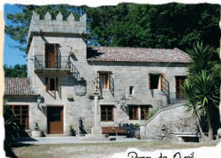
Pazo de Auril

... Xunto coas igrexas e capelas xa mencionadas, e das mostras tradicionais como muíños e lavadoiros, os pazos constitúen as construcións máis singulares da arquitectura en Bueu.