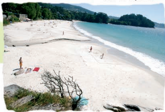
Praia de Lapanán

... No incomparabel marco das Rías Baixas, Bueu conta con máis de dez kilómetros de costa que albergan decenas de praias para todos os gustos, dende recollidas calas como Pedróns (Beluso) ata longos areais como Lapanán (Cela).