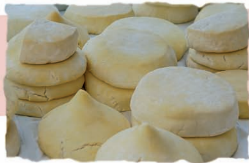
Queixo de tetilla

Os caldos de elaboración artesanal centran celebracións como a Festa do Viño Tinto Femia en Cela (xullo), ou a festividade de Santa Ifigenia, onde é tradicional degustar a sidra na capela do Pazo de Santa Cruz (setembro).