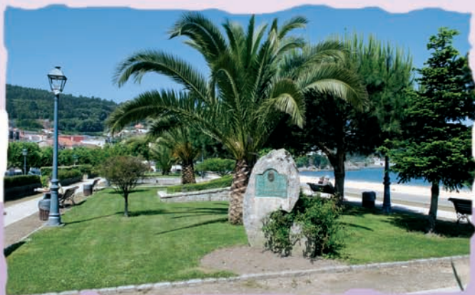
Paseo Banda do Río

Moi preto atópase a Casa do Concello, o Museo Massís e tamén as praias urbanas de Petís e Pescadoira, dende onde se prolonga o paseo marítimo ata alcanzar a Banda do Río, xunto á praia do mesmo nome.