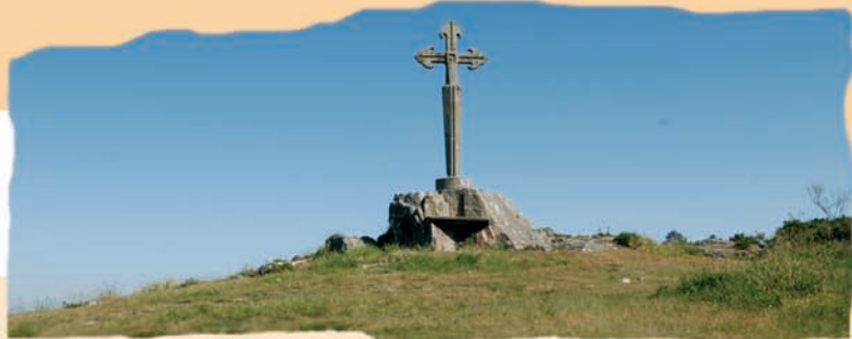
Cruz de Aermelo

Na estrada de subida atopase a igrexa de Santiago de Aermelo, que foi refundada no século XII. O interior do templo alberga unha inscrición pétreo latina que data a súa reconstrución no ano 1102.