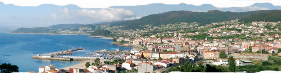
Panorámica de Bueu

Para disfrutar de todo isto e máis, veña e siganos. Acompañámoste nunha viaxe chea de emocións, de lugares maravillosos para visitar e de espazos para coñecer. Fázina a páxina irase adentrando na singularidade desta nosa vila mariñeira.