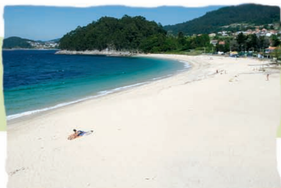
Praia de Fortomaioir