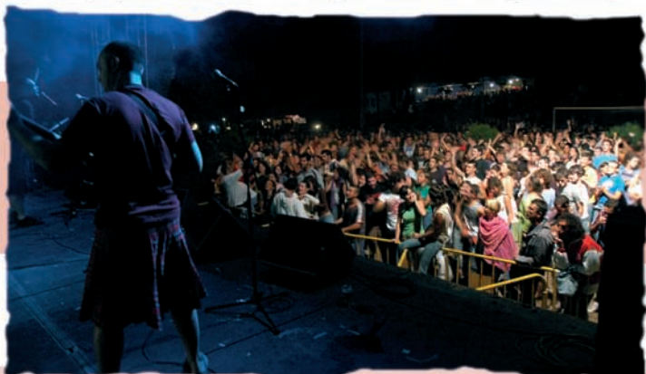
A noite do Tragno