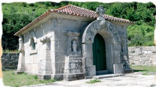
Capela de Santos Reis

Trátase da capela de Santos Reis, construción ubicada en O Valado que reflicta as características da arquitectura e da escultura do artista.