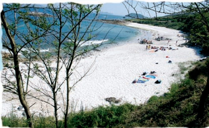
Pría de Área dos Cans

Para pechar este paseo por Bueu, visitaremos as Illas Ons, que forman parte del Parque Nacional das Illas Atlánticas. O arquipélago, situado na entrada da ría de Pontevedra, componse de tres illas,