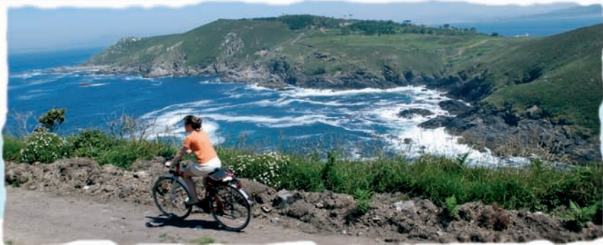
Buraco do Inferno

Ons, Onza e Centulo. Ons mide 6 km de longo por dous de ancho e en tempada turística está comunicada con Bueu, Aldán, Marín, Sanxenxo e Portonovo mediante barcos de pasaxe. Na illa podense facer tres rutas de sendeirismo: a Ruta Histórica, a Ruta Naturista e a Ruta do Faro. Os visitantes desembarcan na zona coñecida como Curro, desde onde se poden dirixir a algunha das praias de area branca e augas cristalinas.