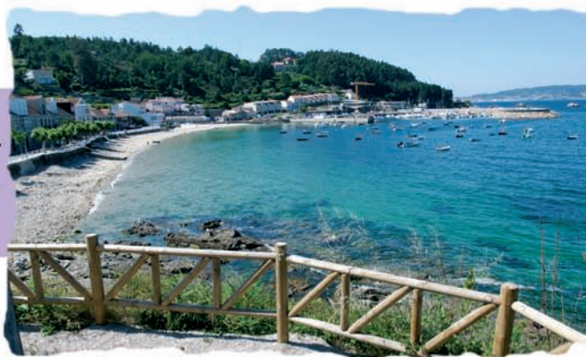
Praia de Beluso

Desde a Rúa Nova tamén temos acceso ás praias de Lagos e Areas de Bon. Dúas estradas máis parten do centro de Beluso, unha de elas con dirección a Bon. Neste lugar atópase a hermiña de San Mamede, do século XVII, onde son de interese a sacristía, o altar