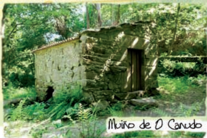
Mouino de O Canudo

Dificultade: Media Distancia: 12 km. Duración: 6 h.