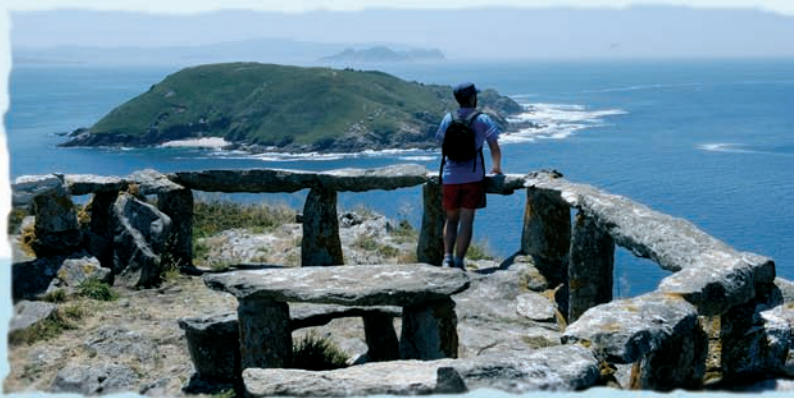
Mirador de Fédorentos

Caminando en dirección ao sur da illa, aparecen as praias de Area dos Cang e Pereiros, antes de chegar ao campamento xestionado pola Xunta de Galicia. O percorrido continúa ata o mirador de Fédorentos e o Burato do Inferno. Tomando o camiño que parte á dereita da igrexa comeza a Ruta Naturista, pola que tras un paseo duns dous kilómetros chégase ata a praia de Melide, onde se pode practicar o nudismo. Punta Centolo, o monte Freitoras, O Cucorno e o Faro son outros puntos de interese na illa, onde se pode pernactar nalgún dos establecementos hoteleiros ou na zona de acampada, para a que se precisa de autorización.