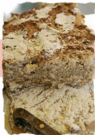
Pán de Millo

Os mariscos e peixes lideran a riqueza gastronómica de Bueu, que conta cunha ampla oferta de restaurantes onde degustar pratos típicos como o arroz con bogavante ou o polbo "à feira". É precisamente este cefalópodo o que conta cunhas xornadas de exaltación, a Festa do Polbo (setembro). O Encontro-Degustación do Millo Corvo (finais de marzo) é outra das citas gastronómicas destacadas, complementada con actividades culturais na aldea de Meiro.