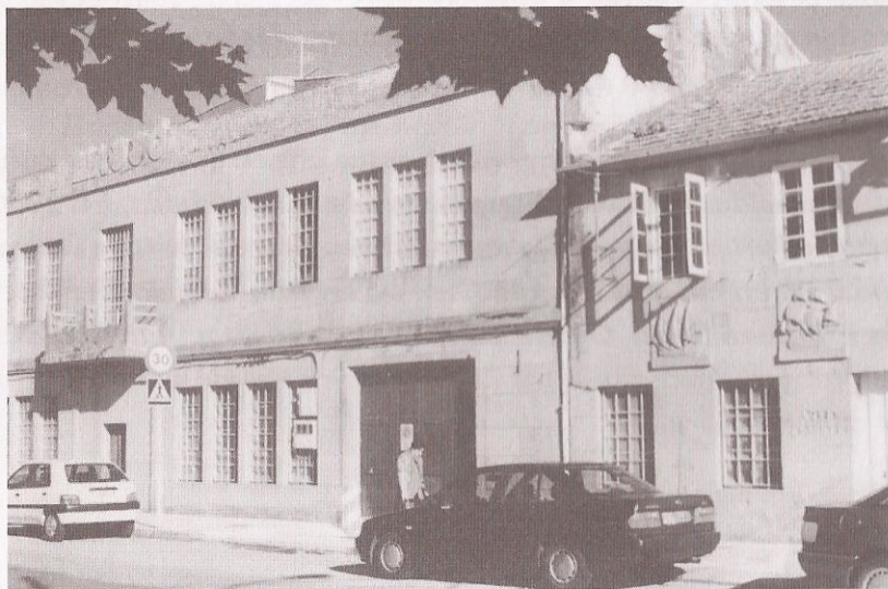
Fachada Museo Masso

Temos señas identificativas tanto do patrimonio cultural como do patrimonio natural que hai que conservar, coidar e promover porque constitúen a nosa memoria histórica.