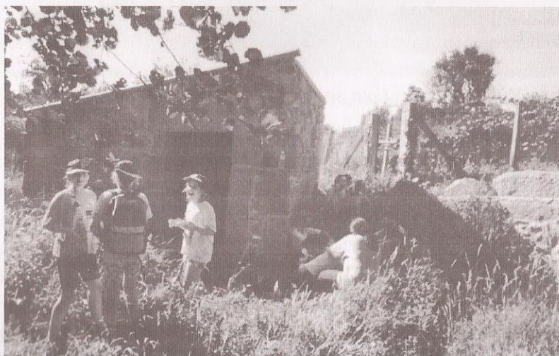
Unha parada no muiño do "Tombo" na ruta de 1998.

Parece como se camiñar rente a estas construcións en ruínas lles devolvera a vida. Así ocorreu polo menos en tres deles. En 1997 a Concellería de Turismo aproveita unha subvención da Xunta e restaura tres muíños, un en cada parroquia: Avical, en Bon-Beluso; Tombo, en Cela; e da Presa, en Bueu. O primeiro, o máis espectacular de tódolos do municipio, ten unha canle de 16 metros por onde vai a auga que entra nun cubo cilíndrico de 8 metros de alto.