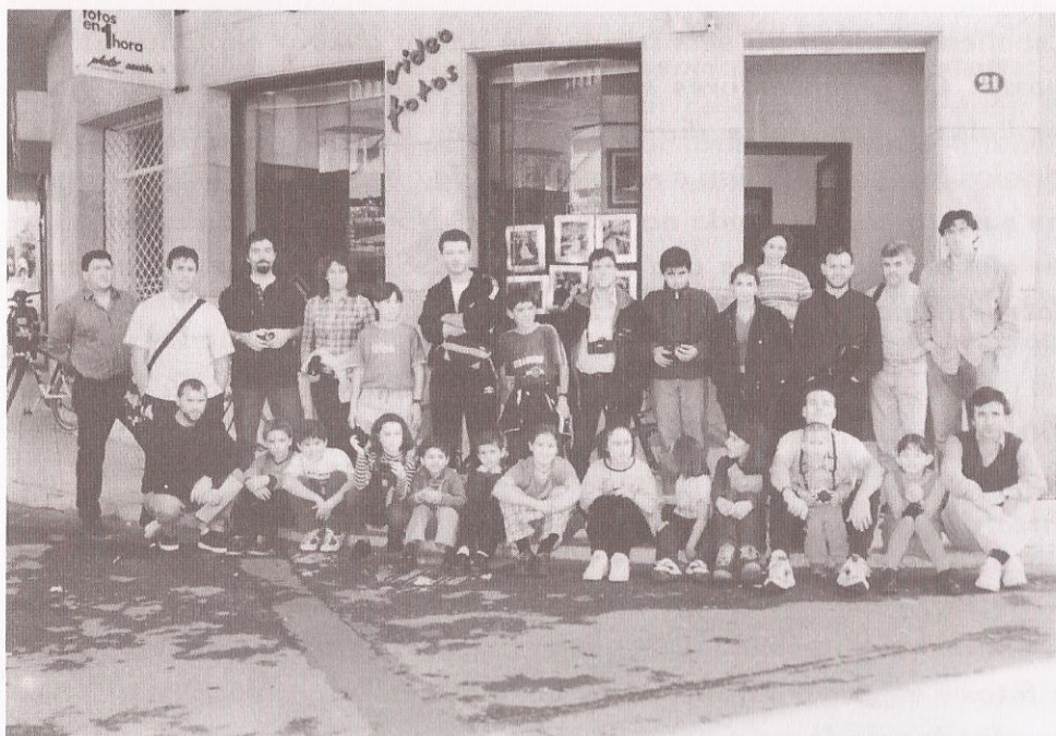
Participantes no X Maratón Fotográfico de 1998