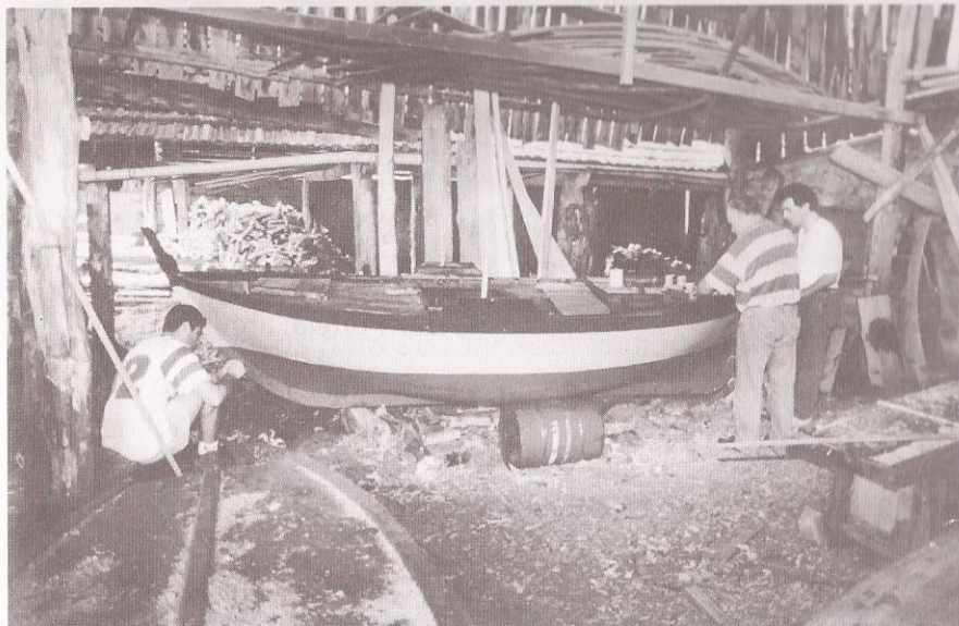
Construción do bote polbeiro "Lagoas" no estaleiro de Manuel González "Purro", da Banda do Río

Que saibamos só existen na actualidade tres embarcacións deste tipo: o do Museo Massó, o da antiga escola de carpintería de ribeira A Aixola, de Marín e o "Lagoas".