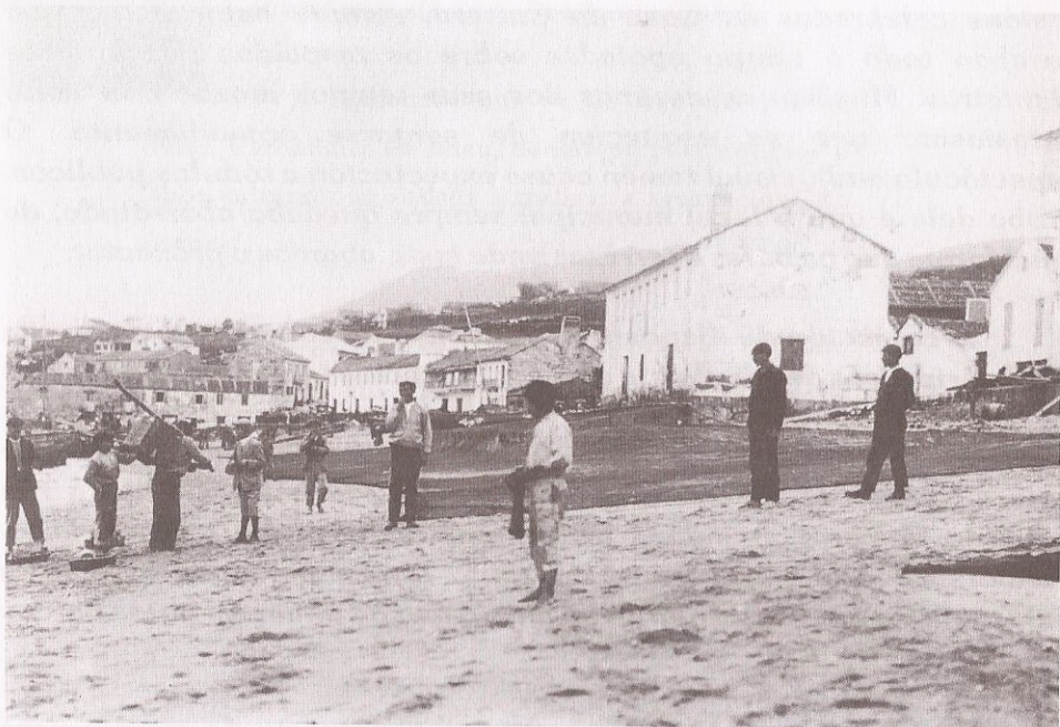
Praia de Pescadoira a primeiros de século

Así mesmo estamos agradecidos ó Concello de Bueu por cedernos un tomo con varios números encadernados de "La Vos de Bueu" para reproducir algunhas noticias. E lamentamos que na actualidade este documento periodístico estea en paradeiro descoñecido.