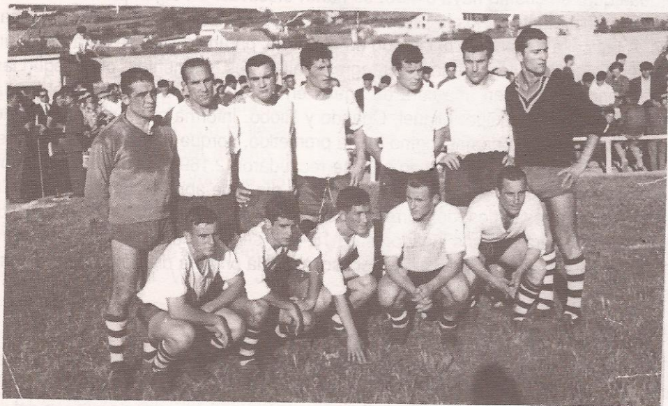
Campo Municipal de Deportes de Bueu. Temporada 1962/63.