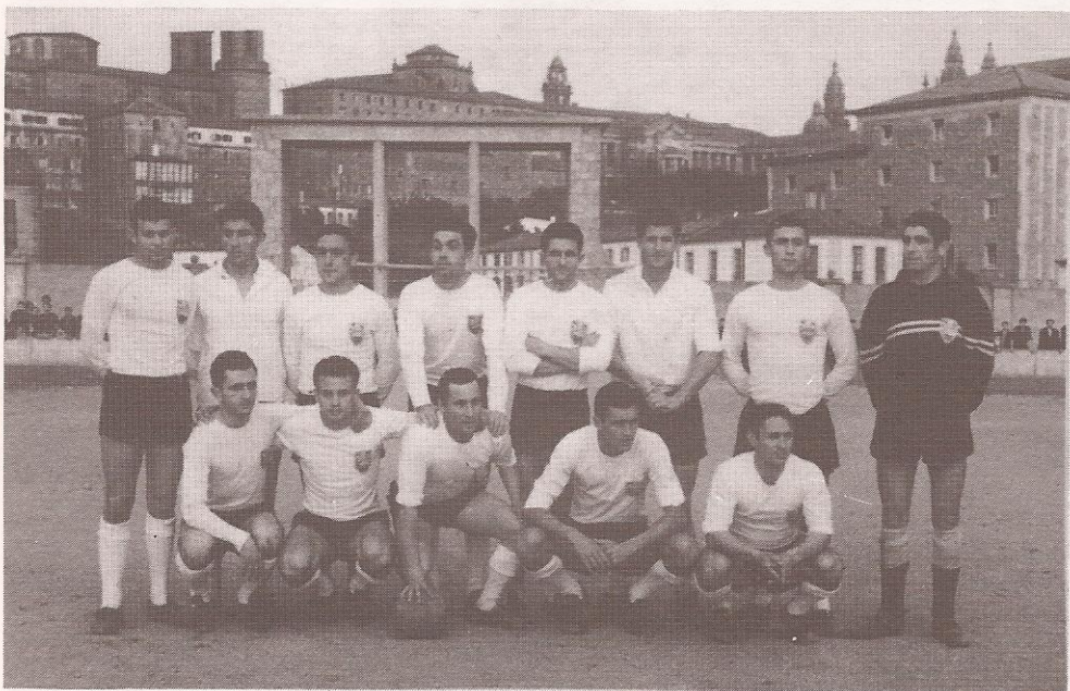
Campo de Santa Isabel. Santiago.

Se acuerda vender al público las insignias del Club al precio de 25 pts.