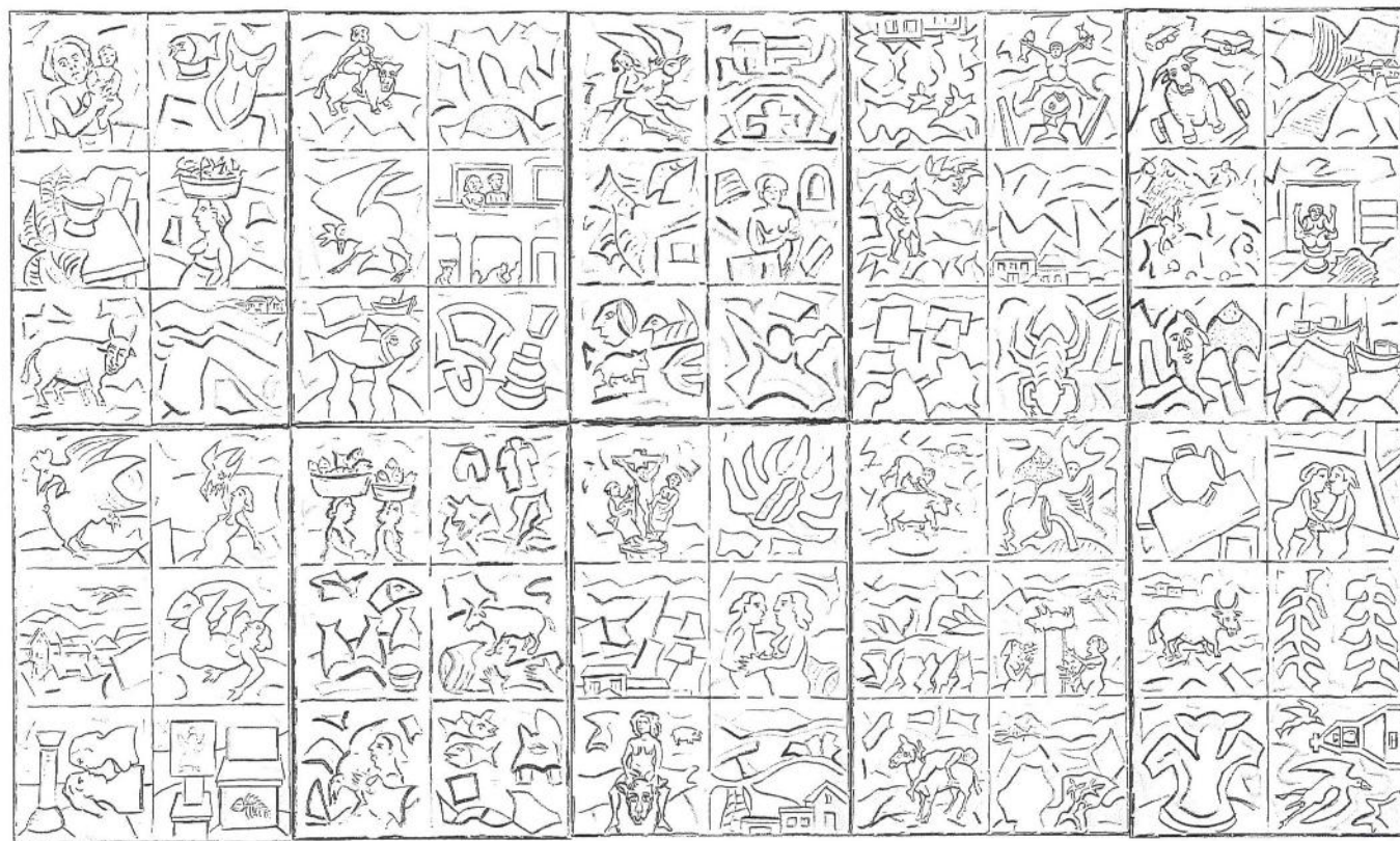
TRASEIRA MURO 1