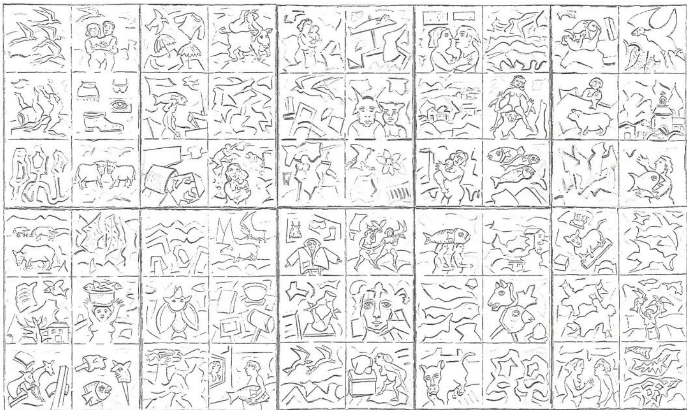
FRONTAL MURO 1