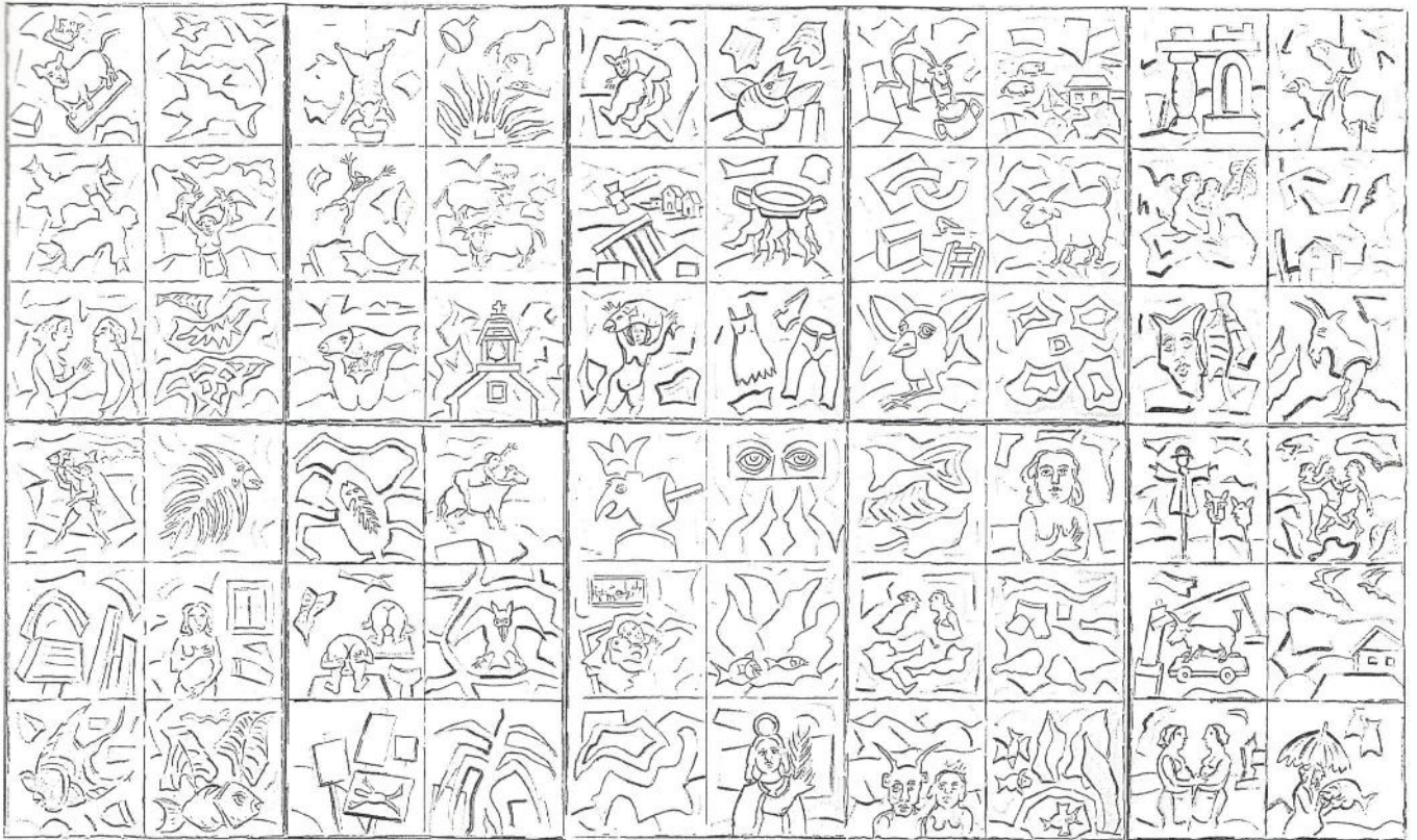
FRONTAL MURO 2