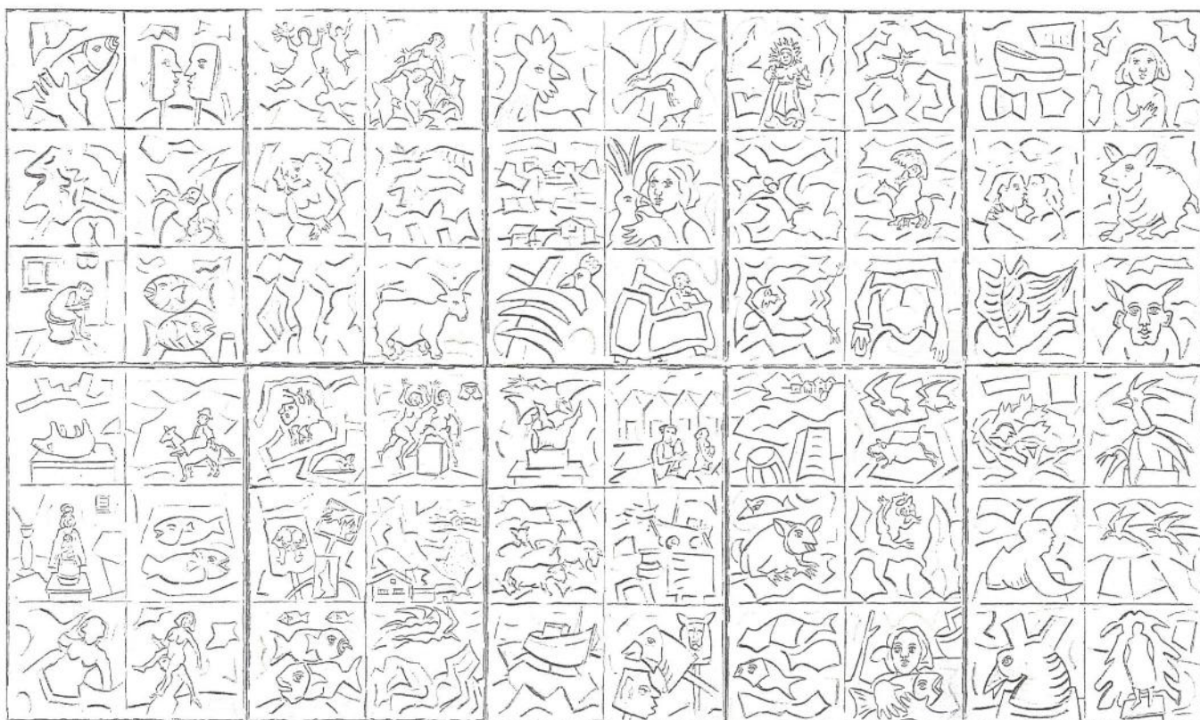
TRASEIRA MURO 2