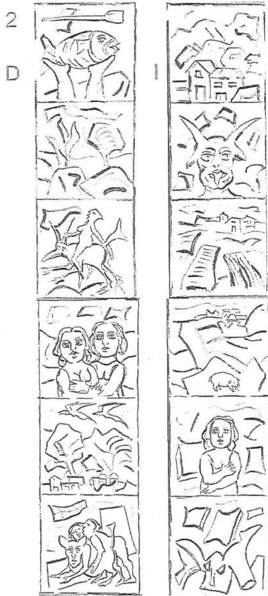
COSTADOS MURO 2