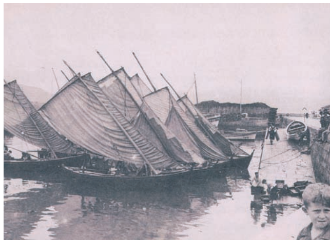
Lanchas en Muros, 1947.

Aplicando o mesmo método "palabras e cousas" de Xocas , pouco despois o alemán W. Schröder publicaba "Die Fischerboote von Finisterre" (1937), un estudo dos barcos de pesca de Fisterra coa descrición etnográfica da lancha, das súas variantes menores e da chalana de fondo plano, xunto co estudo etimolóxico da terminoloxía desas embarcacións.