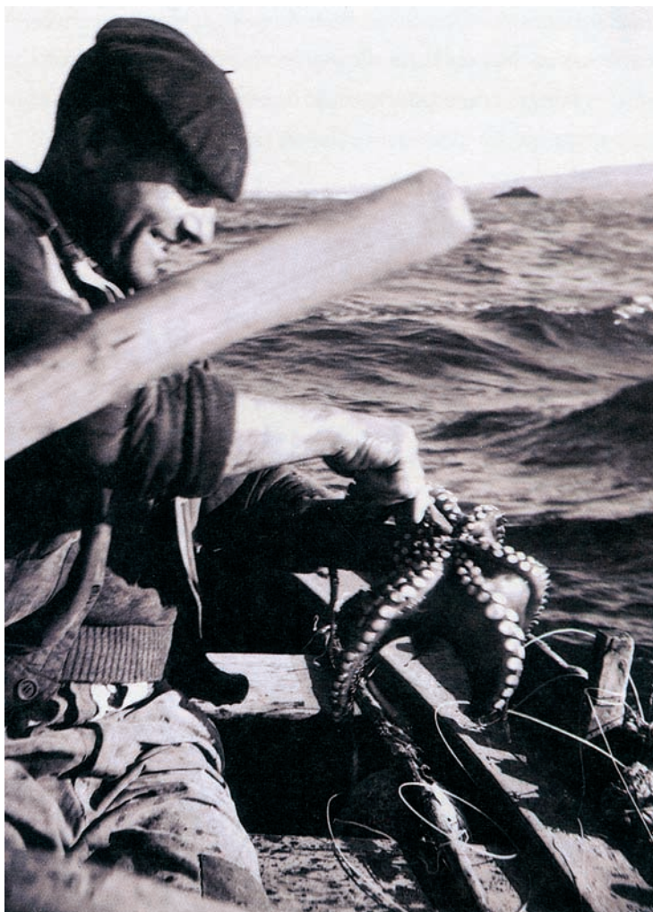
Illa de Ons, 1964.