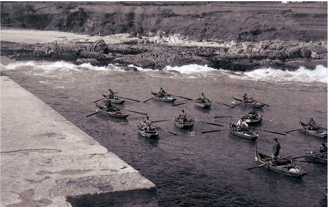
Illa de Ons, 1965.