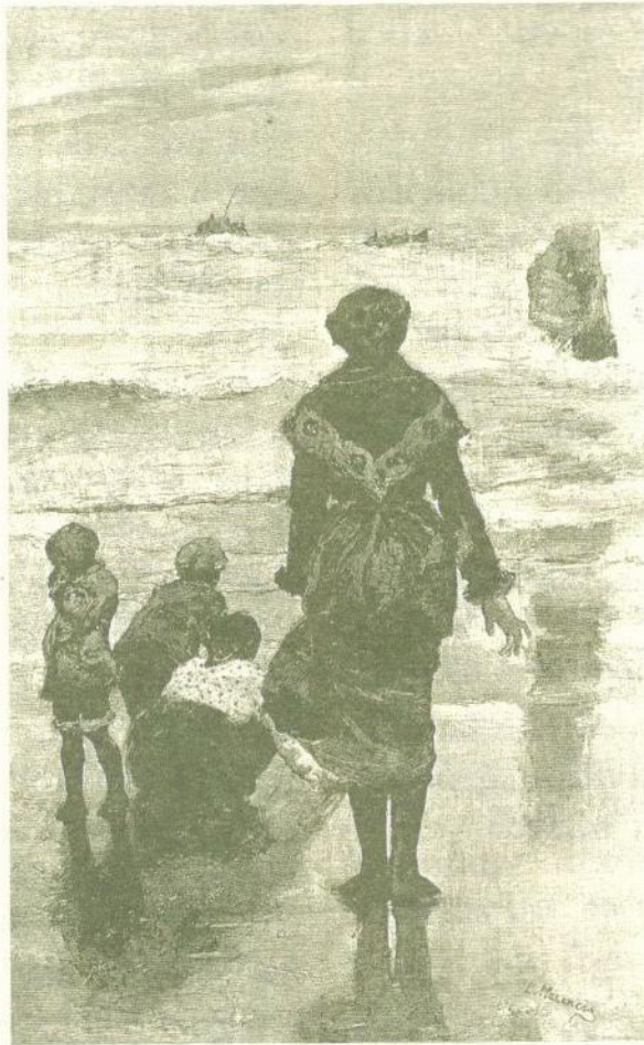
¡Dios mio! ¿Arribarán? Cuadro de D. Castro Plascencia. Ilustración Española y Americana .

animais poden conter determinados sinais etnográficos, mostrándonos o poema ás gaviotas xunto cos golfinhos e arroaces, animais sempre buscados polos mariñeiros por canto lles ofrecen agoiros sobre os resultados pesqueiros ou permítenlles presaxiar a evolución do tempo climatolóxico, fixándose deti-