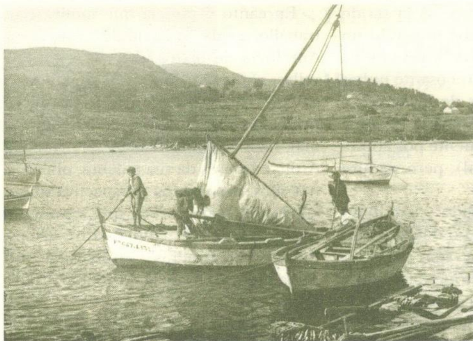
Mariñeiros da ría de Arousa.

del océano” coas súas escuras tormentas.