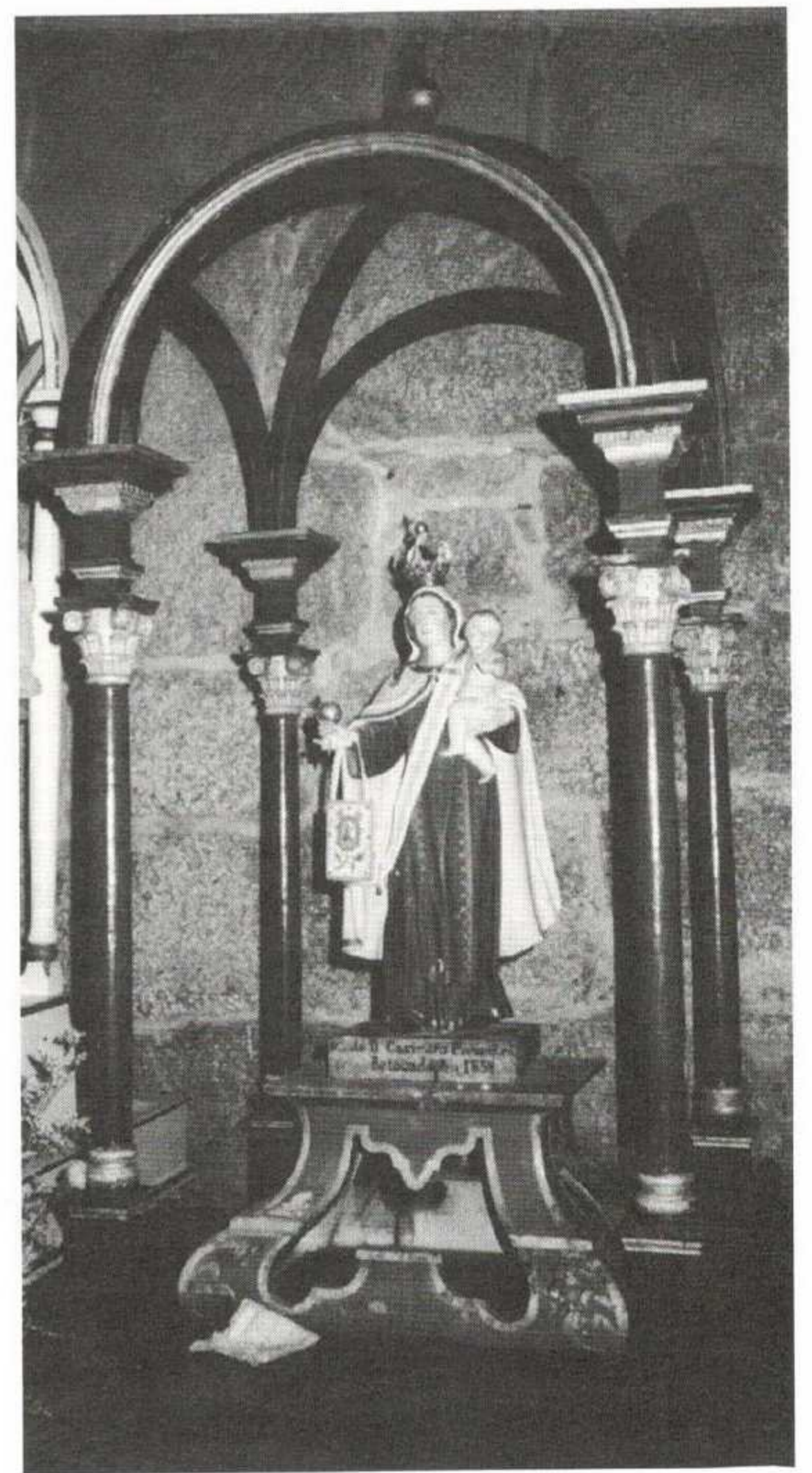
Retablo da Virxe do Carme. Capela de Santa Cruz.

Segundo recolle a tradición, presentóuselle varias veces a Virxe en xeito de milagre, practicando el conversións na súa illa ó tempo que se perfeccionaba relixiosamente. Alcanzando unha idade madura, a Virxe, acompañada dunha chea de seres celestiais,