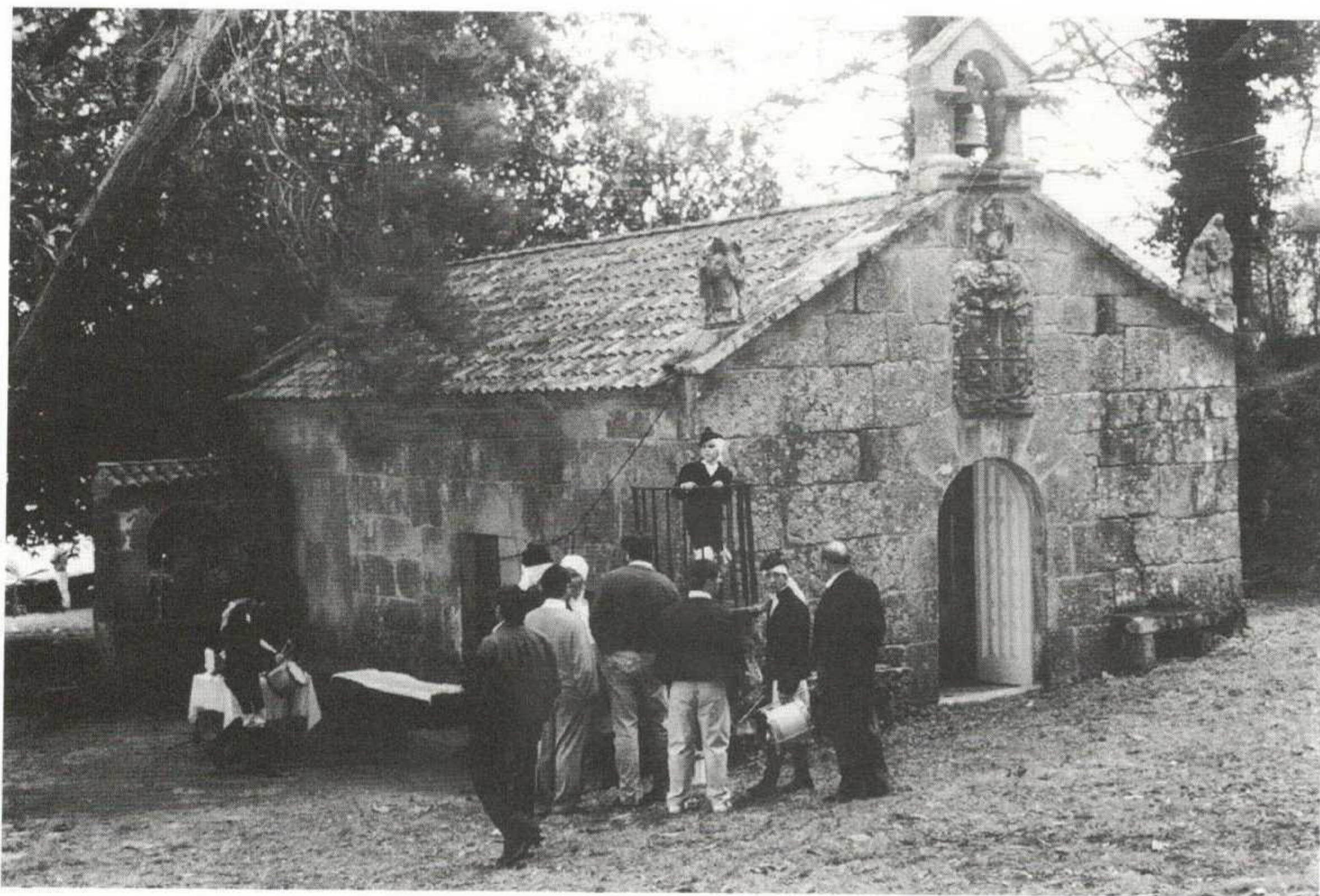
Capela-Ermida de Santa Cruz.

a data máis próxima anterior ou posterior.