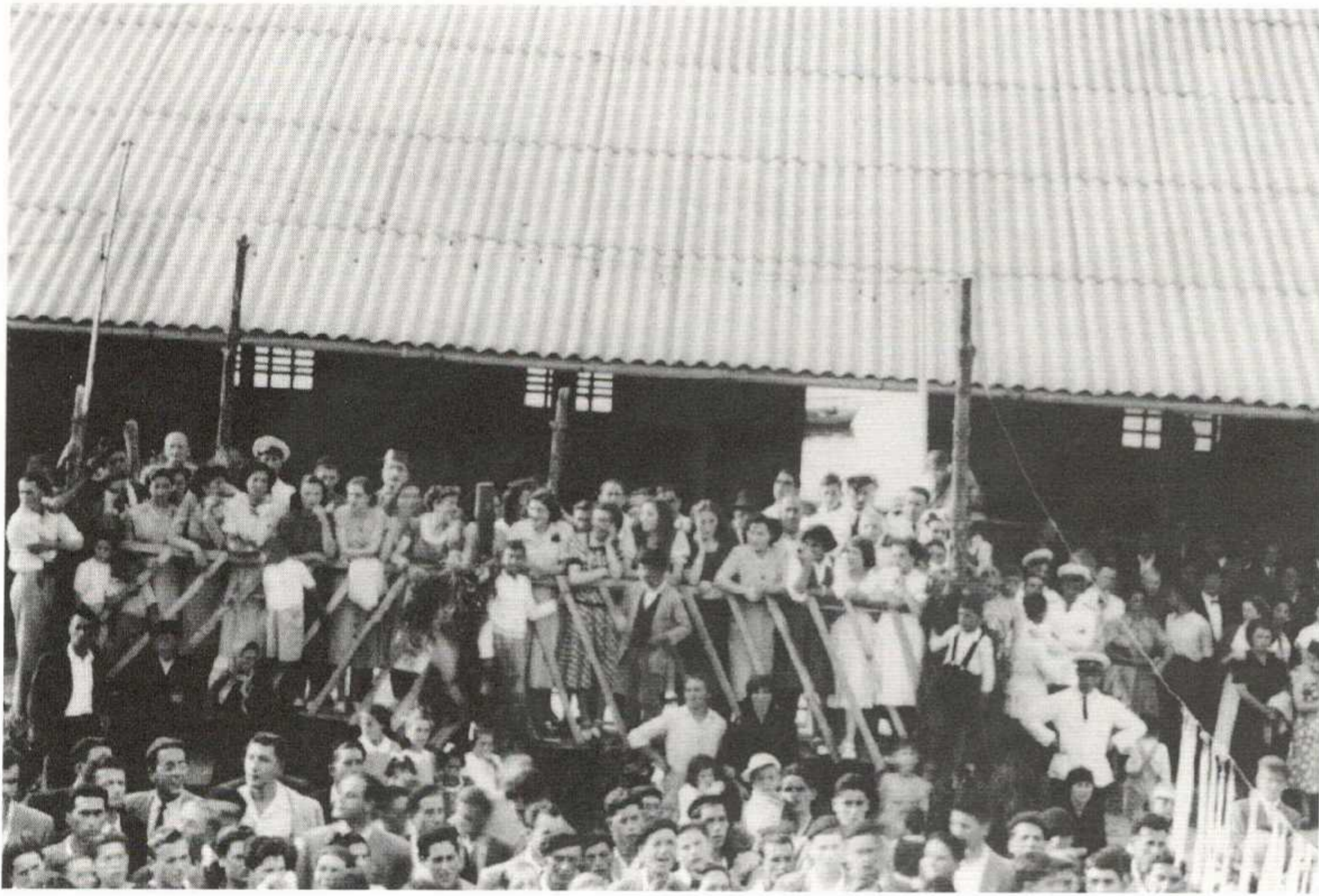
Carreira de cintas en Bueu.