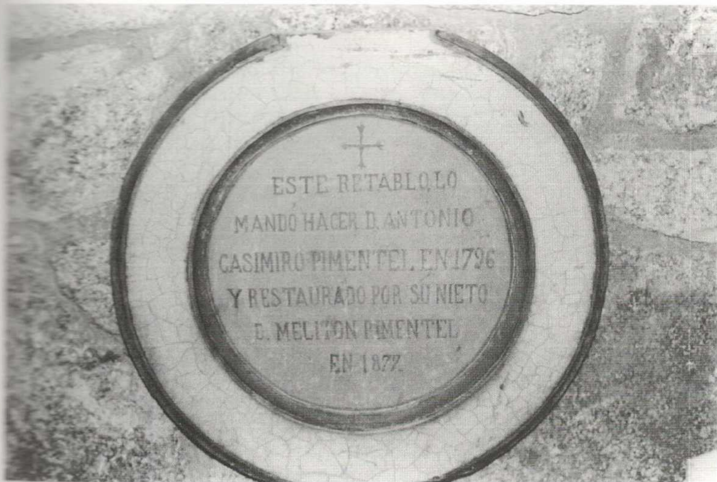
Lenda que acompaña ó referido retablo.