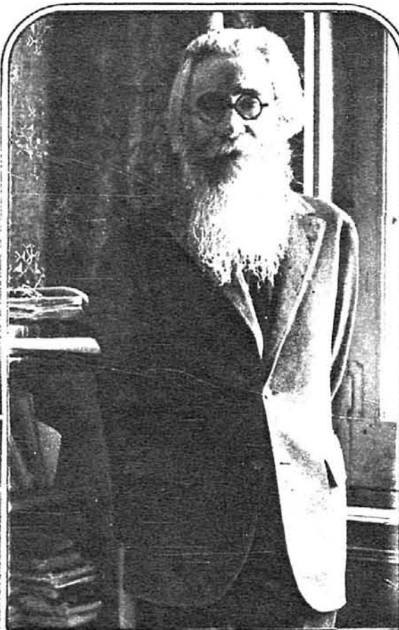
D. Ramón del Valle Inclán, el auténtico señor de la Arosa por mar y por tierra.

puede contener exactamente a todos estos genios.