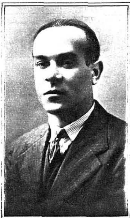
El humorista «Caramiñas», nacido también en La Puebla.