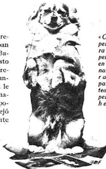
«Gedeón», personaje fuera de la lista, pero incluido en estas páginas por su rara habilidad para usar anteojos. Es el perro de los hermanos Camba.

Julio Camba y Francisco Camba.—También son de Villanueva. El pueblo apenas si