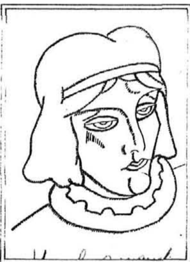
El poeta Macías, «el Enamorado», también de Padrón.