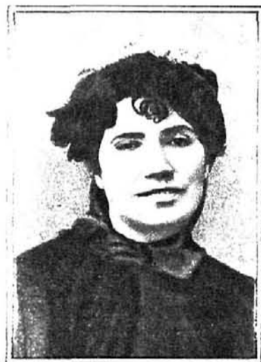
La poetisa Rosalía de Castro, de Padrón.

Como se ve, estas aguas maravillosas lo mismo dan pescados que santos, locos y poetas. Yo propongo, desde ESTAMPA, cuaderno de curiosidades, que se cierre con una valla el área de esta ría, se la declare algo nacional y se muestre a los turistas con ese ademán trascendental con que se señalan las cosas raras y maravillosas.