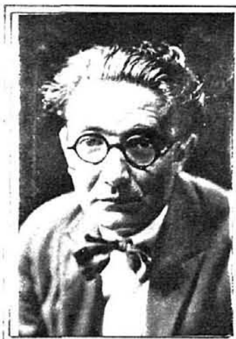
El dibujante Alfonso R. Castelao, de Rianjo.