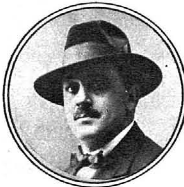
Ramón Cabanillas, poeta, de Cambados.