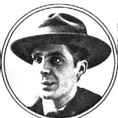
Carlos Maside, pintor, de Puentecesures.