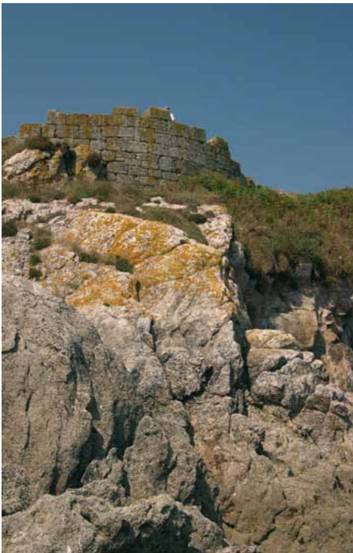
Bateria coñecida como “Castelo da Rueda”, próxima ao peirao.

veciños, dun xeito pouco claro, se resolve a favor do Marqués de Valladares, que queda como único “propietario”. A mediados do século XIX, o Marqués aluga a uns fomentadores cataláns os terreos próximos ao peirao onde antes estiveran instaladas os barracóns onde durmían os obreiros e alí instalan unha fábrica de salga. Esta industria da salga vai traer un importante cambio económico: a agricultura e gandería pasan ao campo do autoconsumo e o traballo na fábrica e a pesca van a ocupar os labores dos illáns.