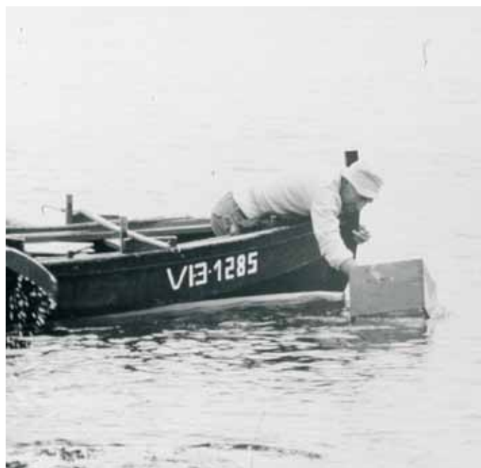
Mariñeiro pescando polbo coa arte do espello.