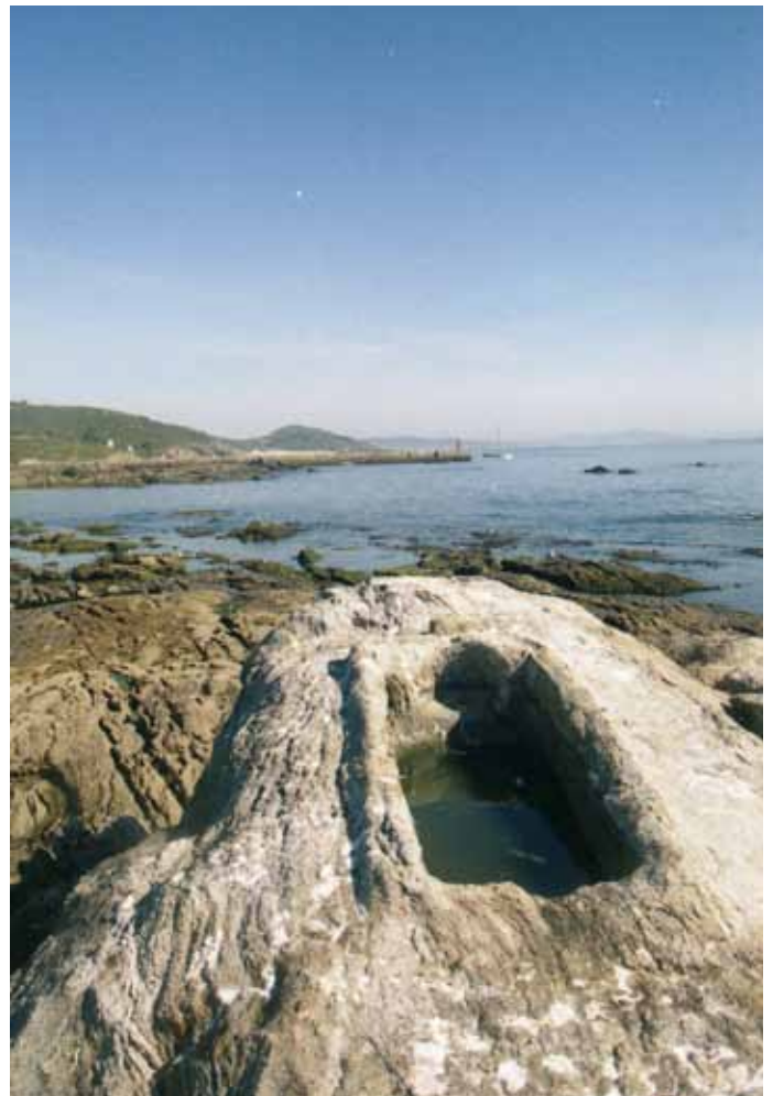
Sepulcro antropomorfo coñecido como “Laxe do Crego”.

Non sabemos se as familias destes mariñeiros do Barbanza foron finalmente recrutados para traballar, o que si hai datos é de que a gran maioría dos obreiros que viñeron a Ons para a construción das fortificacións - baterías procedía da bisbarra do Morrazo e